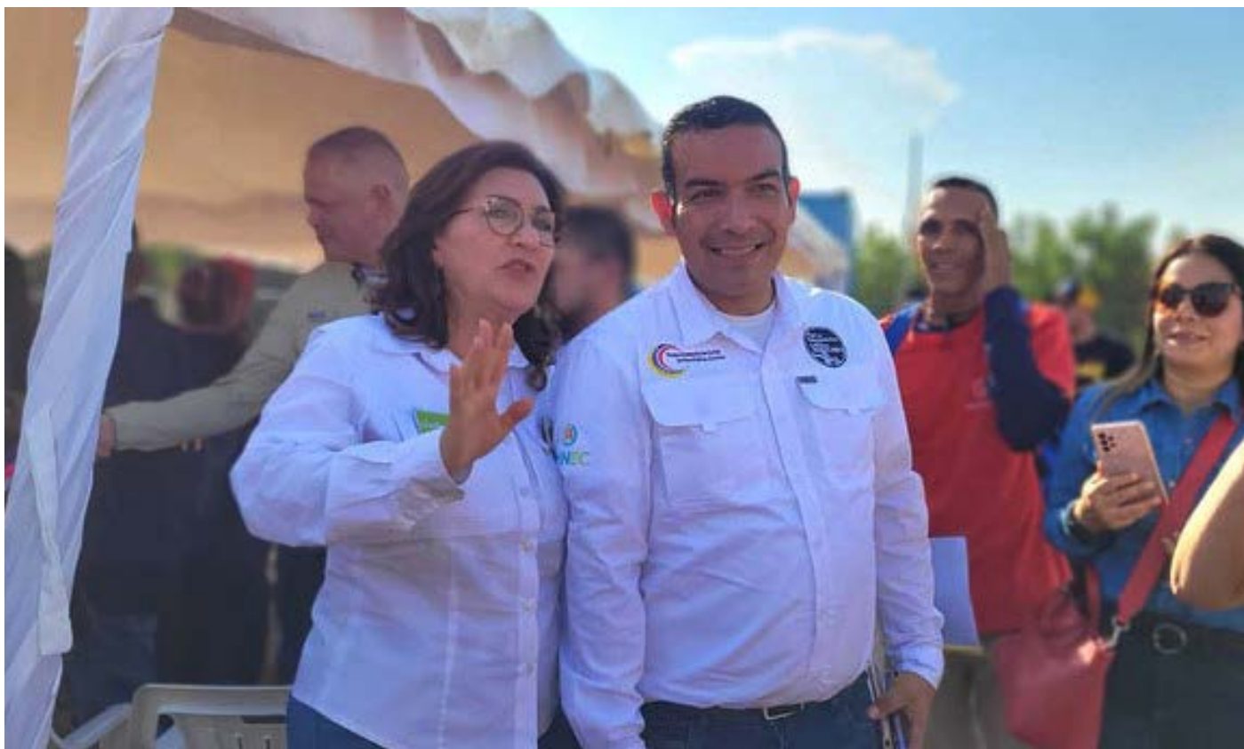
A Minec dispõe de uma equipa de profissionais, paisagistas, que estão ao seu serviço

No entanto, explicou que o local precisa de uma reformulação estrutural porque não vai prestar os mesmos serviços que prestava há alguns anos. "Vai ser um jardim zoológico e vai ser adaptado a espaços de lazer", concluiu.