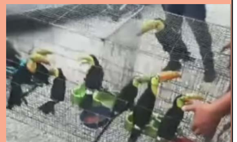
Dois indivíduos detidos em ligação com este incidente

Defesa do Ambiente e Crimes Ambientais para investigar uma queixa relacionada com o alegado contrabando de animais selvagens.