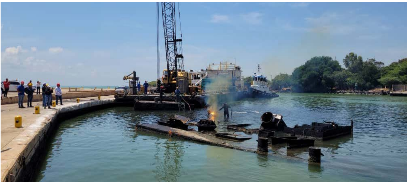
Trata-se de um projeto de "limpeza" de todo o passivo ambiental dos portos do país

"Se hará una dotación de 400 insumos entre los que se encuentran luminarias led, depósitos de reactivos y aires acondicionados, entre otros", explicó Lorca.