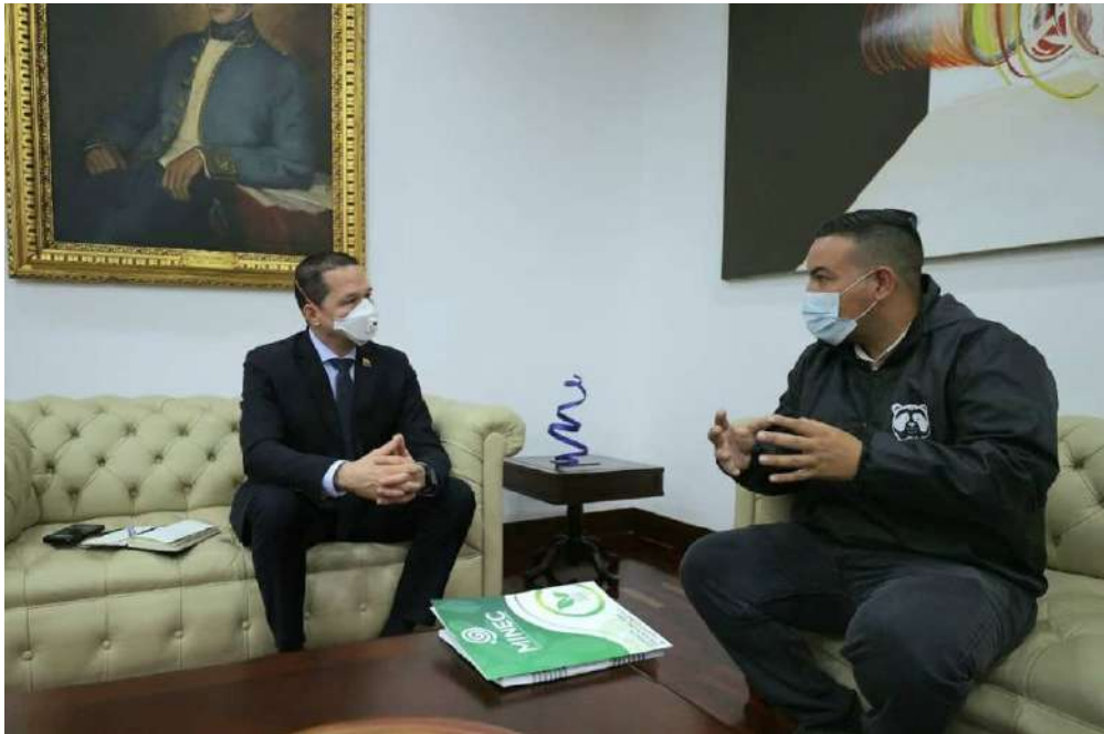
Los ministros Lorca y Faría analizaron las estrategias de cooperación

Con el objetivo de concretar los aspectos a manejar en la 27a Conferencia de las Naciones Unidas sobre el Cambio Climático de 2022