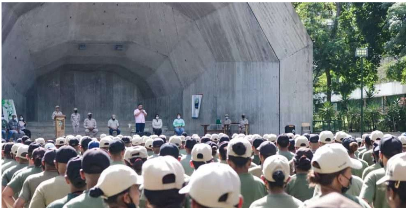
Lorca: "los guardaparques son héroes y heroínas de la Patria"

Los nuevos guardianes de la naturaleza corresponden a 207 del Dis-