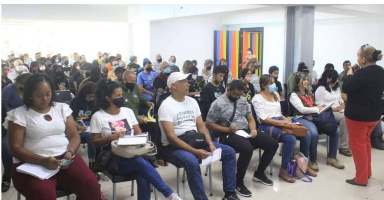
La actividad contó con 103 participantes

“Va dirigido al público en general, servidores del Minec, estudiantes universitarios, brigadas contra el cambio climático, guardaparques, bomberos forestales y trabajadores y trabajadoras invitados de otras instituciones”, dijo Álvarez.