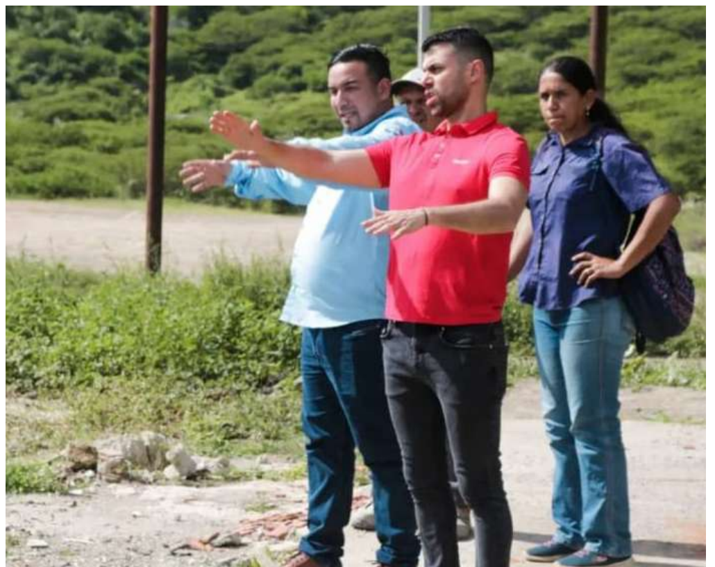
El ministro Lorca inspeccionó el área donde funcionará la nueva instalación