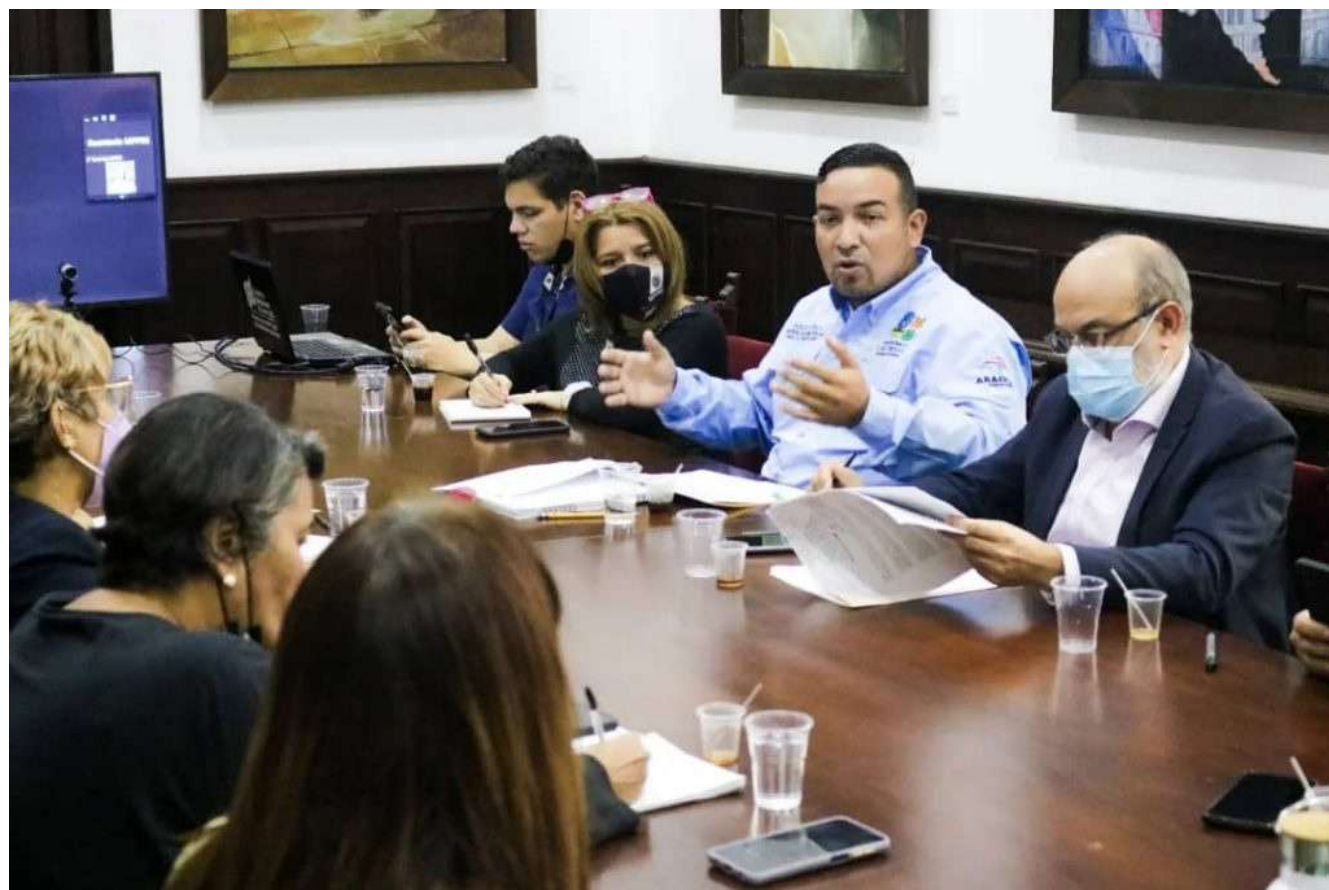
Distinto ministerios participaron en la actividad

A utoridades del Ministerio del Poder Popular para el Ecosocialismo (Minec), Cultura (Mppc), Relaciones Exteriores (Mppre) y el Instituto de Patrimonio Cultural (IPC), analizaron los avances en el fortalecimiento del Parque Nacional Canaima como Patrimonio de la Humanidad.