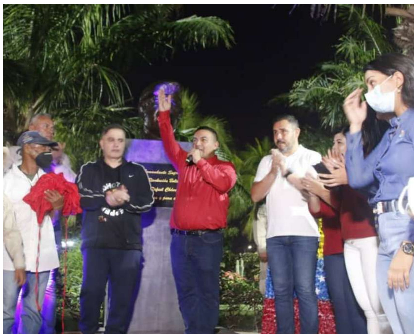
El ministro Lorca Junto a otras autoridades realizaron la reinauguración

pulmón vegetal más importante del oriente del país, por tamaño y por metro cuadrado este parque simboliza eso, y está entre los principales parques de Venezuela”.