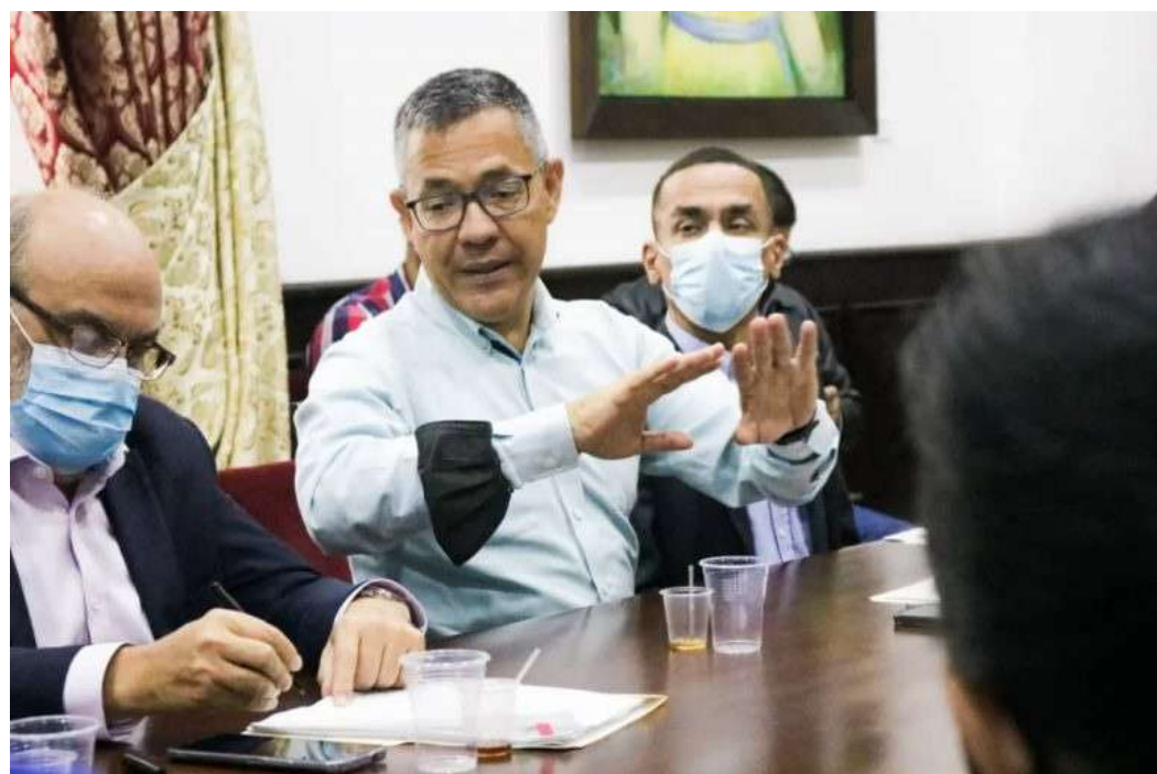
El ministro Villegas estuvo presente

Además, se registra el responsable desempeño del Gobierno Nacional para preservar y proteger el Parque Nacional Canaima como Patrimonio Mundial, y mantener el Valor Excepcional Universal (VUE).