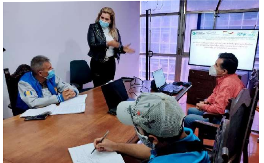
Evalúan y analizan la propuesta de la trazabilidad

En esta línea, el Minec, Topam C.A. y la Organización del Tratado de Cooperación Amazónica (OTCA), evalúan y analizan la propuesta de la empresa Topam C.A. de fortalecer el Sistema de Guías Electrónicas