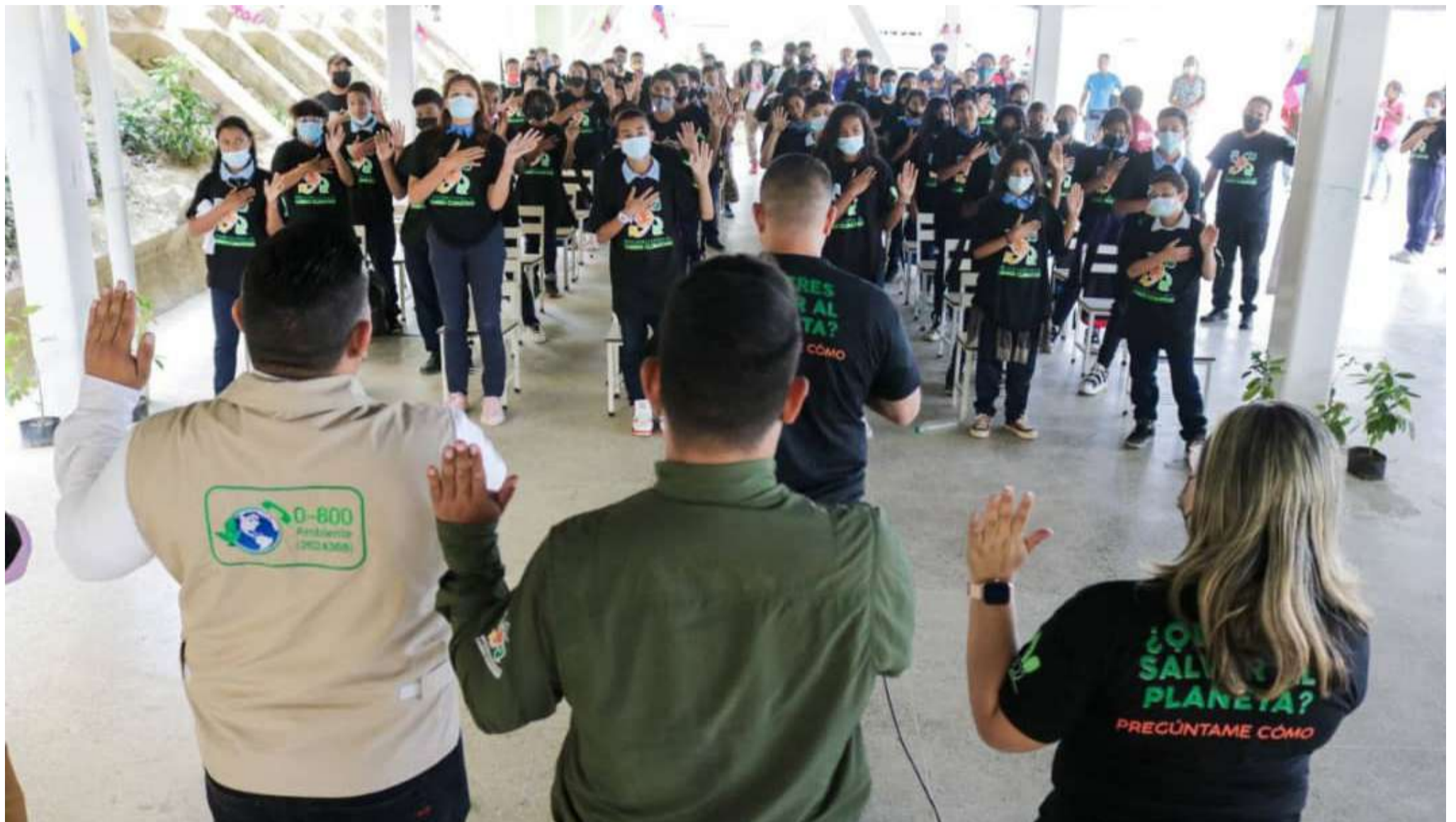
Estudiantes del Liceo Nacional Gran Cacique Guaicaipuro de Ciudad Caribia se juramentaron

E l ministro del Poder Popular para el Ecosocialismo, Josué Lorca, juramentó a 65 jóvenes que pasarán a formar parte de las Brigadas contra el Cambio Climático.