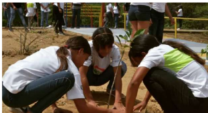
Las ecobrigadas constituyen la nueva cultura ecosocialista

El Ministerio del Poder Popular para el Ecosocialismo (Minec), con el apoyo de las recién juramentadas Brigadas Contra el Cambio Climático en el estado Falcón, plantaron más de doscientos árboles en el