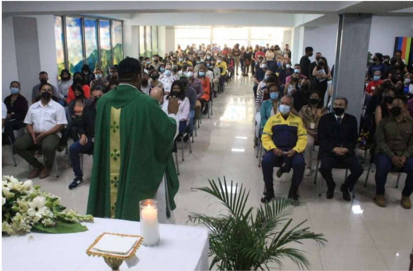
El párroco extendió las bendiciones a los trabajadores

Como parte de los actos conmemorativos por los cuatro años del Ministerio del Poder Popular para el Ecosocialismo (Minec), se celebró una misa en el Salón Warraira Repano, ubicado en el piso 6 de la institución, en la Torre Sur de El Silencio, en el centro de la capital.