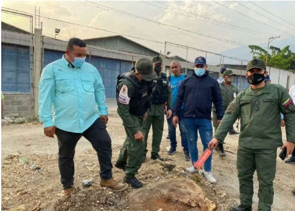
Lorca verificou as reclamações recebidas

Para a devida perícia e laudo técnico, o Ministro do Poder Popular para o Ecosocialismo, Josué Lorca, e pessoal especializado, inspecionaram o