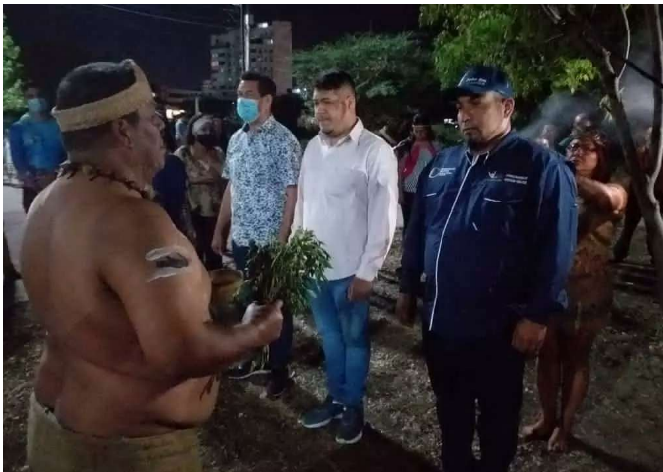
As obras receberam a benção dos povos nativos

O ministro Lorca refletiu sobre o significado do Dia Mundial da Terra: " Todo 22 de abril o mundo inteiro reflete sobre as ações negativas dos seres humanos que