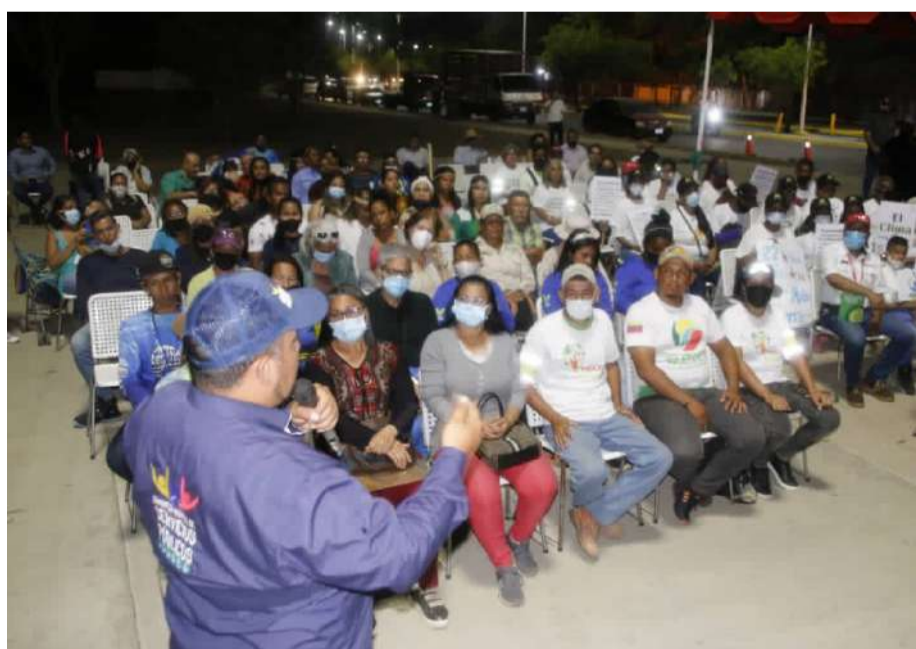
Lorca informou a instalação de equipamentos de saneamento

Por fim, fez um apelo para unirmos esforços nesta tarefa "exigimos o apoio e a soma de todas as vontades, políticas, civis e, sobretudo da comunidade científica para reforçar este estudo, visto que este coral invasor tem aproximadamente 17 anos no país, e é letal para nossas colônias de corais, sufocando-as e, portanto, afetando nossa fauna marinha, atividade pesqueira e o abastecimento alimentar de nosso povo".