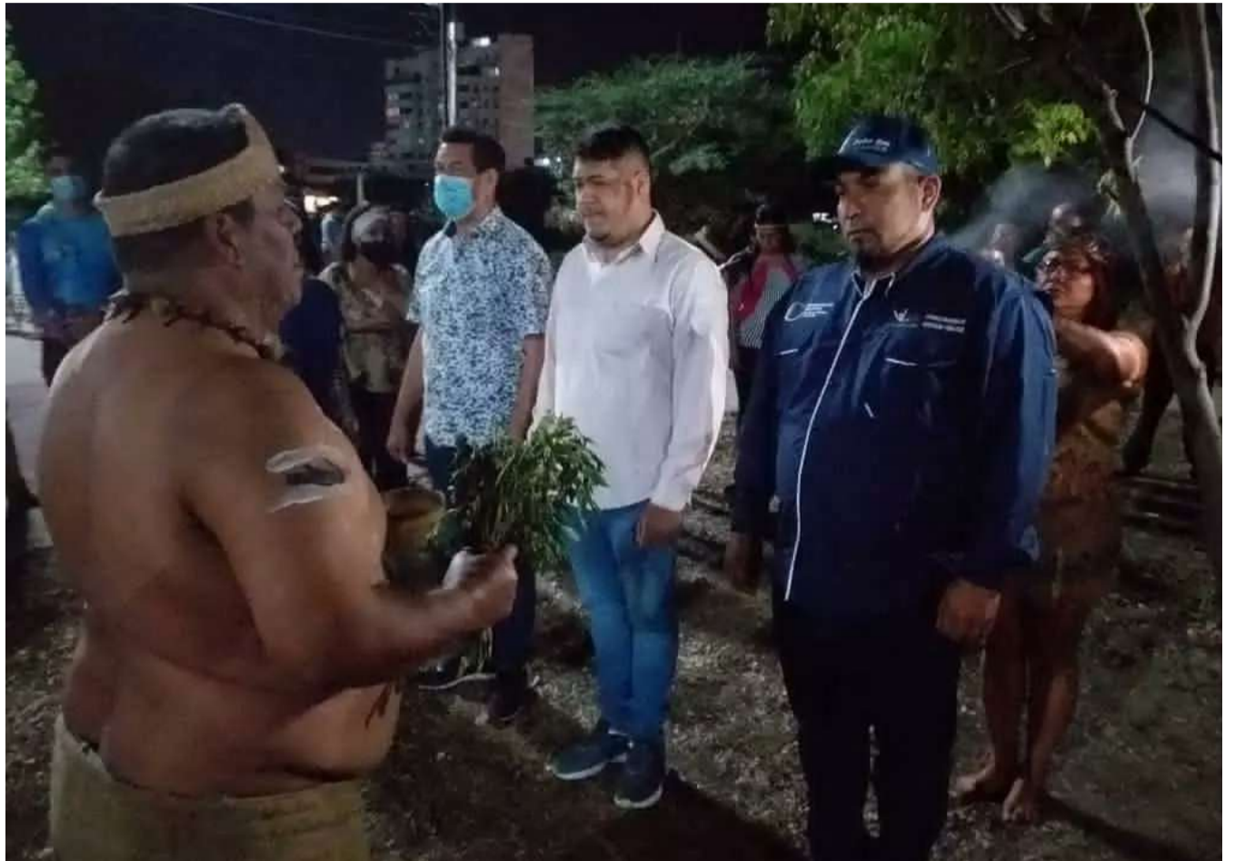
Los trabajos recibieron la bendición de los pueblos originarios

El ministro Lorca reflexionó sobre el significado del Día Mundial de la Tierra: "cada 22 de abril el mundo entero reflexiona sobre las acciones negativas de los seres humanos que impactan di-