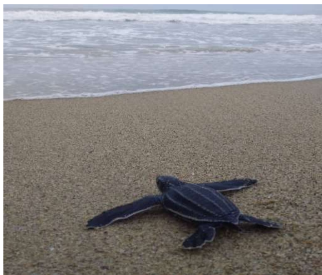
30 crías de tortuguillos fueron liberadas

La actividad tuvo el acompañamiento del personal de la Dirección General de Diversidad Biológica del Ministerio del Poder