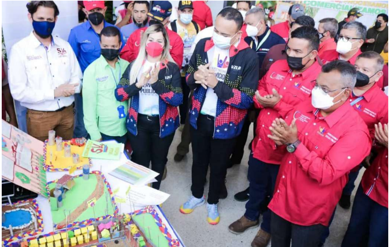
Debatirán proyectos en beneficio de la comunidad

El Vicepresidente Sectorial reconoció el trabajo de la Fuerza Armada Nacional Bolivariana (FANB) y aseguró que el eje transversal de la estabilización de los servicios públicos tiene que ir de la mano con la seguridad y la su-