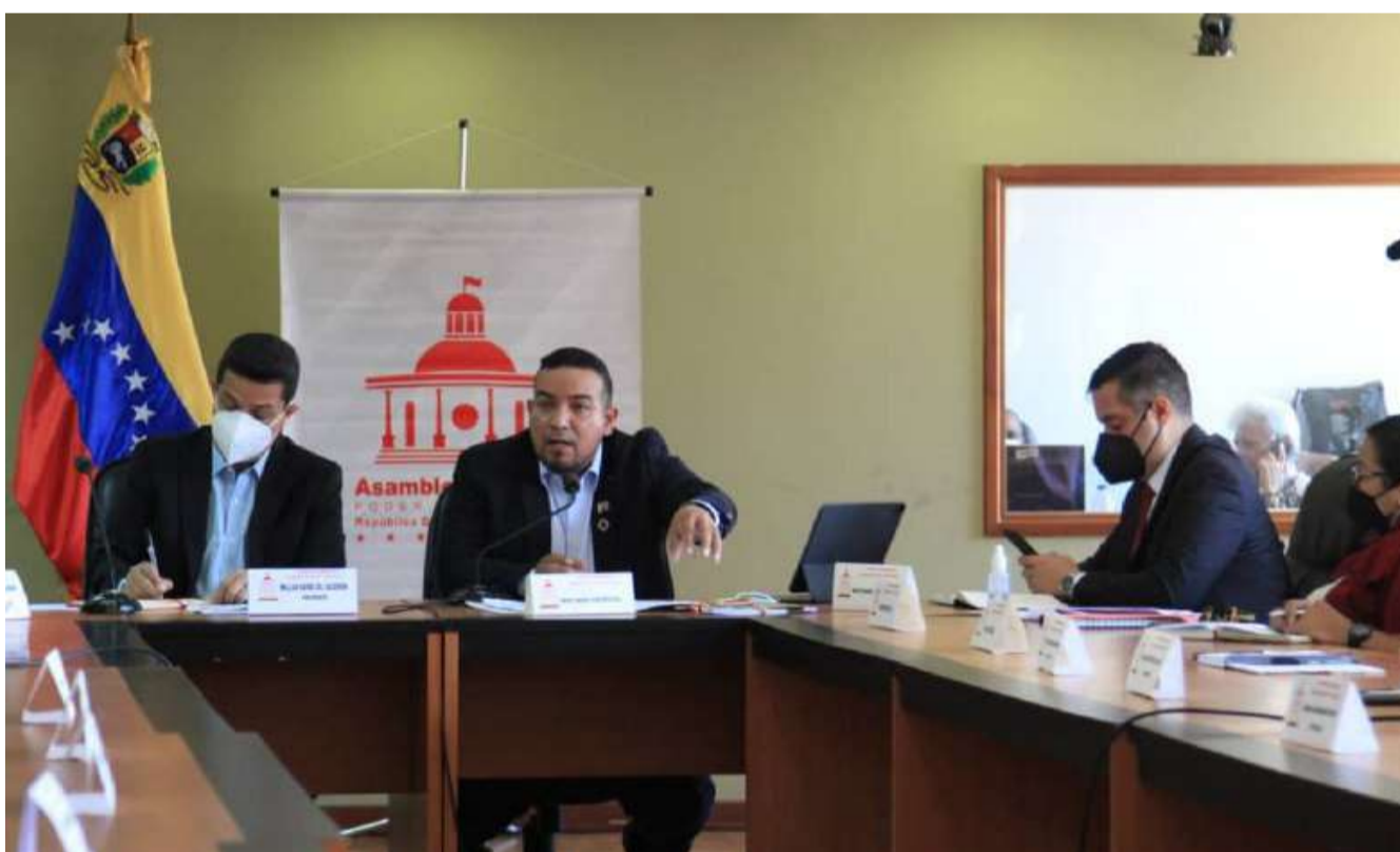
Garantizarán un retiro eficaz de la basura

“El presidente Nicolás Maduro anunció que este 2022 es el año de los servicios públicos, y nosotros estamos cumpliendo la instrucción con esta presentación, que va ahora a su ciclo natural de debate con el Poder Popular para ser mejorada y que tengamos una Ley ro-