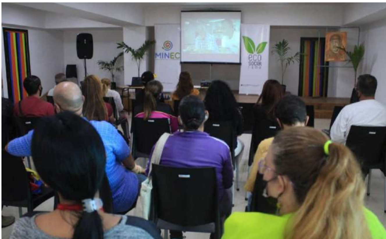
El documental plantea que la siembra de árboles salva el clima

En la continuación del ciclo de cineforos denominado “Cambio climático, pueblos, planeta y vida”, la Dirección General de Formación del Ministerio del Poder Popular para el Ecosocialismo (Minec), proyectó el documental “Nuevos bosques para proteger mejor nuestro clima”.