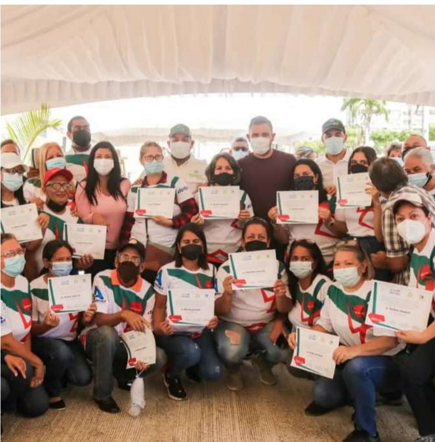
Será impulsado el plan "Todo se transforma"

El pasado sábado 26 el ministro del Poder Popular para el Ecosocialismo Josué Lorca junto al gobernador del estado Anzoátegui, Luis José Marcano y la alcaldesa del municipio Simón Bolívar de la mencionada entidad, Sughey Herrera, impulsaron la implementación del plan de reciclaje "Todo se transforma", así como la juramentación de