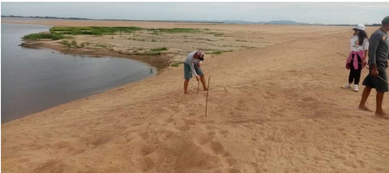
Esta acción busca preservar la especie

Los equipos de trabajo de la Dirección General de Coordinación de las Unidades Territoriales Ecosocialistas (UTE) Amazonas y Apure, sincronizados con la Dirección General de Diversidad Biológica del Minec y la Gobernación del estado Amazo-