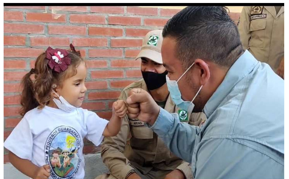
Lorca compartió con los niños presentes en la inauguración

“Este año vamos a reiniciar, luego de cinco años detenidas, la cría en cautiverio de la tortuga en el refugio Santa María”, precisó.