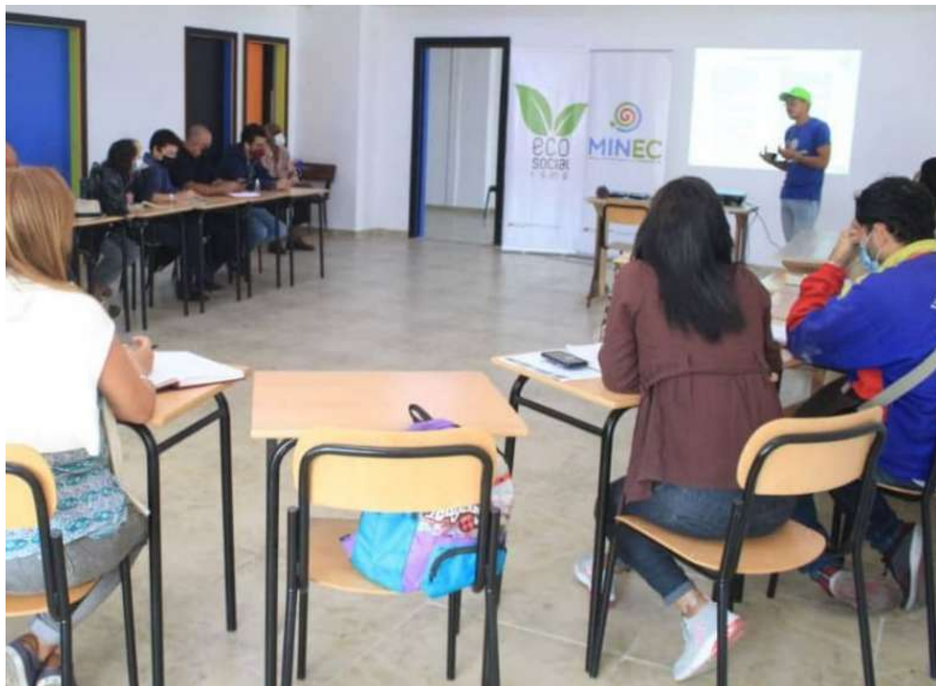
La meta para el 2022 es plantar un millón de árboles

Para canalizar los esfuerzos del Ministerio del Poder Popular para el Ecosocialismo (Minec) y sus entes adscritos, se instalaron mesas técnicas para fortalecer la Estrategia Nacional de Reforestación 2022-2023.