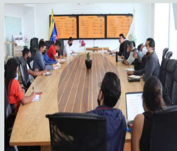
Se espera incrementar la producción de plantas