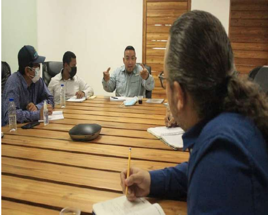
Buscan el fomento y articulación con el Poder Popular

El ministro del Poder Popular para el Ecosocialismo (Minec), Josué Lorca, junto a diversas autoridades de dicha cartera, participaron en una inducción sobre el funcionamiento del Sistema de Integración Comunal (Sinco).