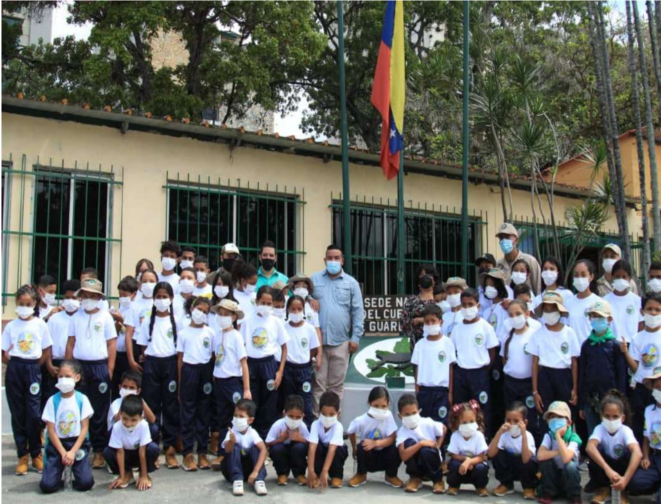
Más de 2700 niñas y niños conforman los pequeños guardaparques

Este sábado, el ministro del Poder Popular para el Ecosocialismo, Josué Lorca, participó en la inauguración de la primera sede de los Pequeños Guardaparques, ubicada en la avenida Rómulo Gallegos al este de la Gran Caracas, asiento del Cuerpo Civil de Guardaparques.