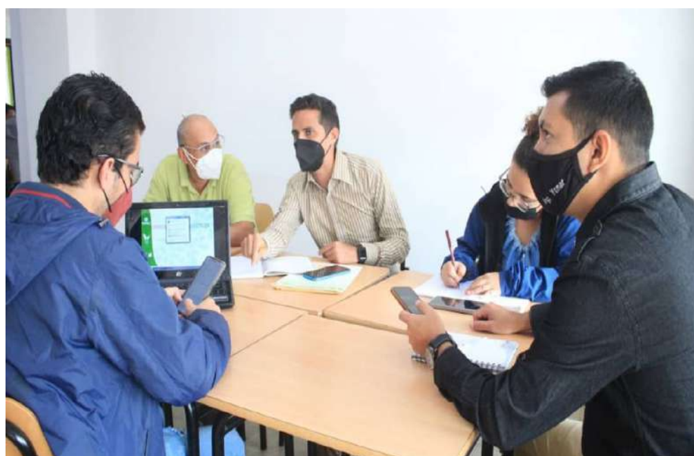
Está previsto el lanzamiento del Plan Nacional de Reforestación a finales de este mes

“En principio, la Estrategia Nacional de Reforestación contiene cinco programas: urbanismo, agroforestería familiar, sembrando vida, conservando, y un árbol un estudiante”, concluyó.