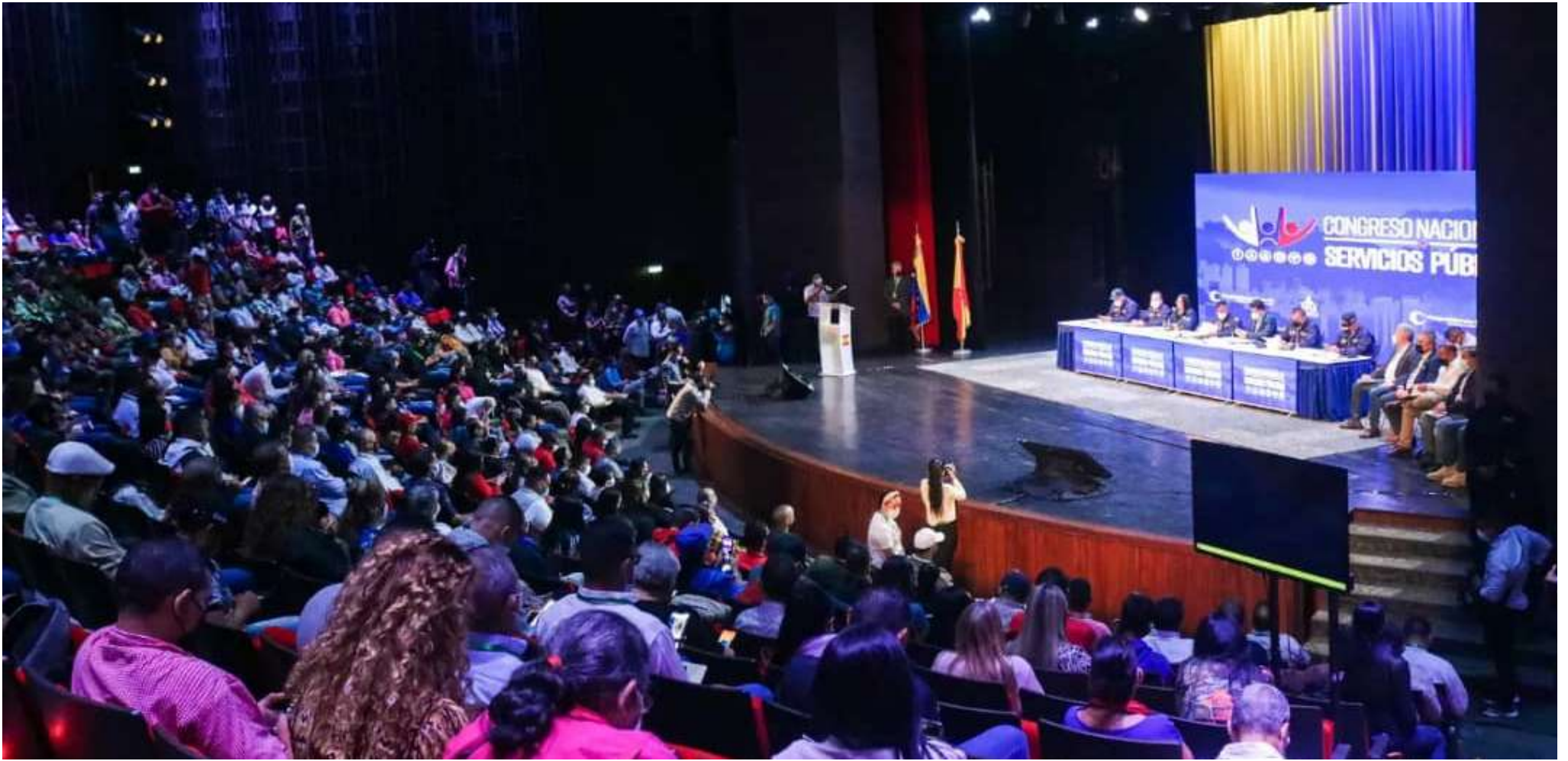
Mesas de trabajo serán permanentes

Este miércoles, en el Teatro de la Ópera de Maracay (TOM), ubicado en el municipio Girardot, se instaló el primer Congreso de los Servicios, Capítulo Aragua, con presencia del vicepresidente de Servicios y Obras Públicas, G/J Néstor Reverol, y los ministros que integran la instancia del Poder Ejecutivo.