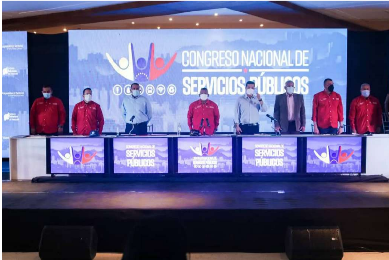
Durante el congreso trazaron hojas de ruta con soluciones

Este miércoles, se realizó el Congreso Nacional de Servicios Públicos, capítulo Mérida, durante el cual se abordaron temas importantes, entre ellos, el inicio de operaciones de Conviasa, en el aeropuerto Alberto Carnevali en Mérida.