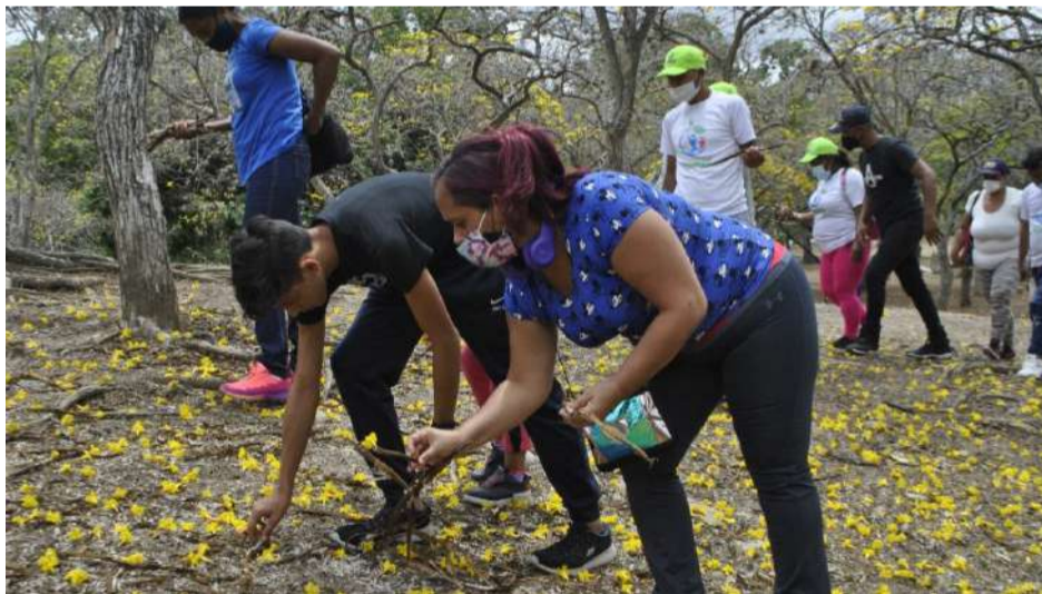
Durante la actividad se recogieron 200 kilos de desechos blancos

S ervidores públicos del Ministerio del Poder Popular para el Ecosocialismo y de la Fundación Misión se desplegaron en el Parque Recreacional Generalísimo Francisco de Miranda, al este de la Gran Caracas, para realizar una jornada de recolección de semillas y a la vez retirar desechos blancos, que comprenden plásticos, vidrios, cartón, papel y metales como el aluminio.