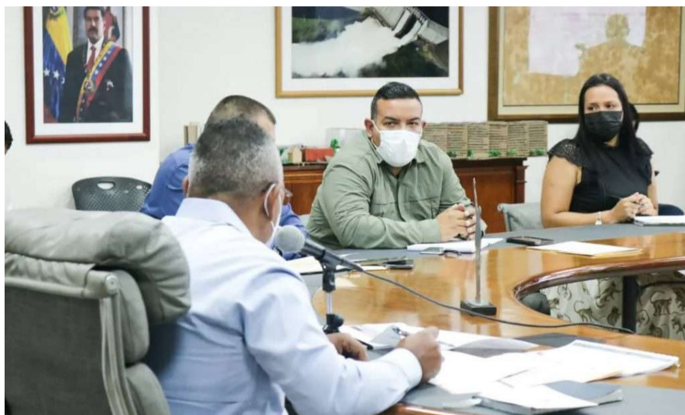
La escuela de reciclaje servirá de vitrina para otras iniciativas similares

El pasado lunes, la Vicepresidencia Sectorial de Obras Públicas y Servicios, realizó su reunión semanal para hacer un balance de las gestiones llevadas adelante y los planes a desarrollar, en procura de adecuar todos los servicios en las comunidades del país.