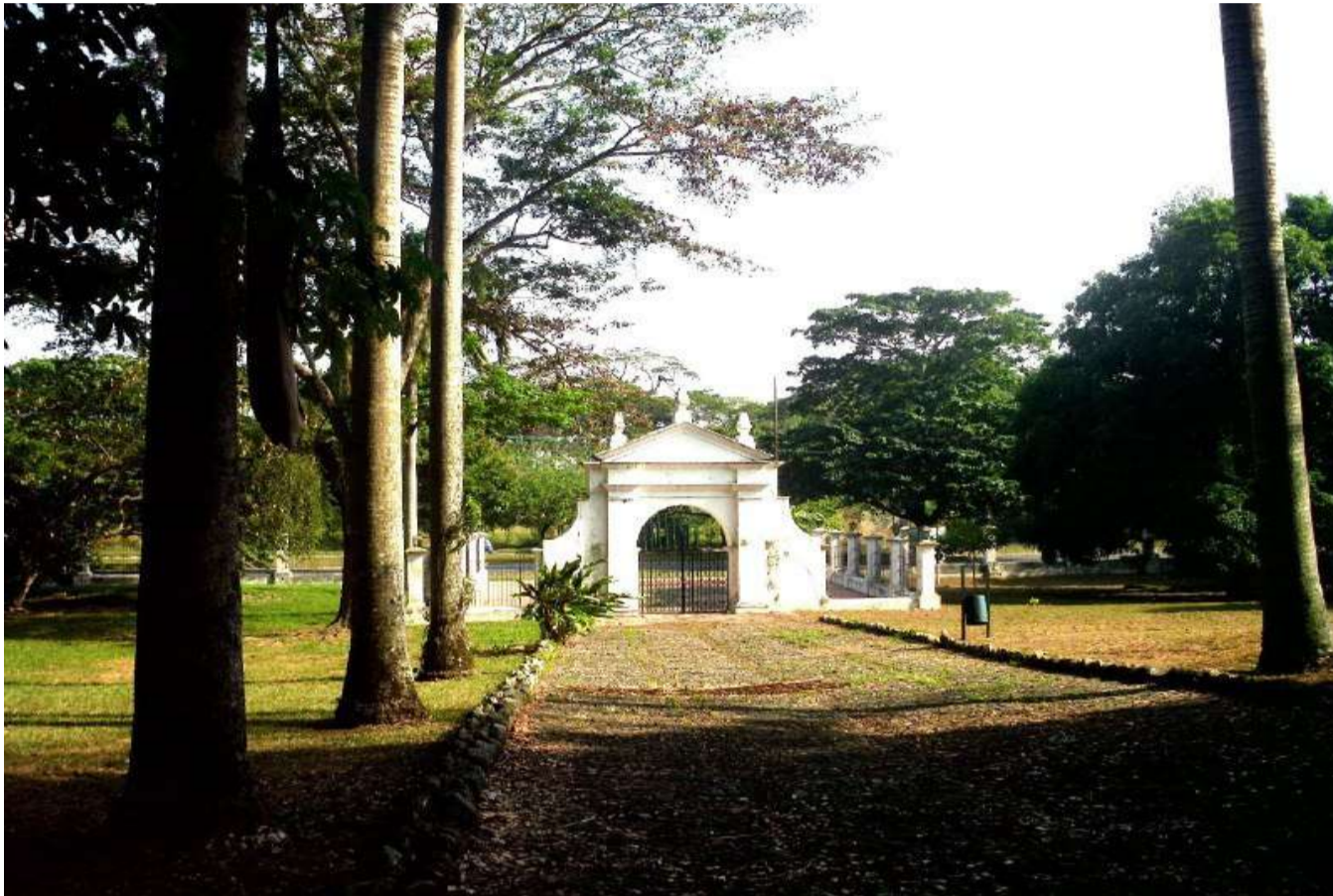
Es el primer y único parque histórico en condición de reliquia en el país

E l Parque Histórico Arqueológico San Felipe el Fuerte fue Inaugurado el 6 de Marzo de 1974 y declarado Monumento Histórico Nacional en 1985. Actualmente, el parque, también llamado “La Pompeya Venezolana”, por su valor histórico y ser el primero en su tipo en el país, está bajo la administración del Instituto Nacional de Parques (Inparques), ente adscrito al Ministerio del Poder Popular para el Ecosocialismo (Minec).