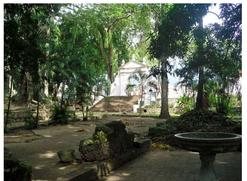
El parque arribó a su 48 aniversario

Durante su recorrido el visitante se topará con las antiguas calles empedradas, la plaza central y una pared de la iglesia Nuestra Señora de la Presentación. Pero no solo ir a este parque representa una visita al pasado, actualmente el espacio sirve como hábitat de animales como las Perezas o los pájaros carpinteros.