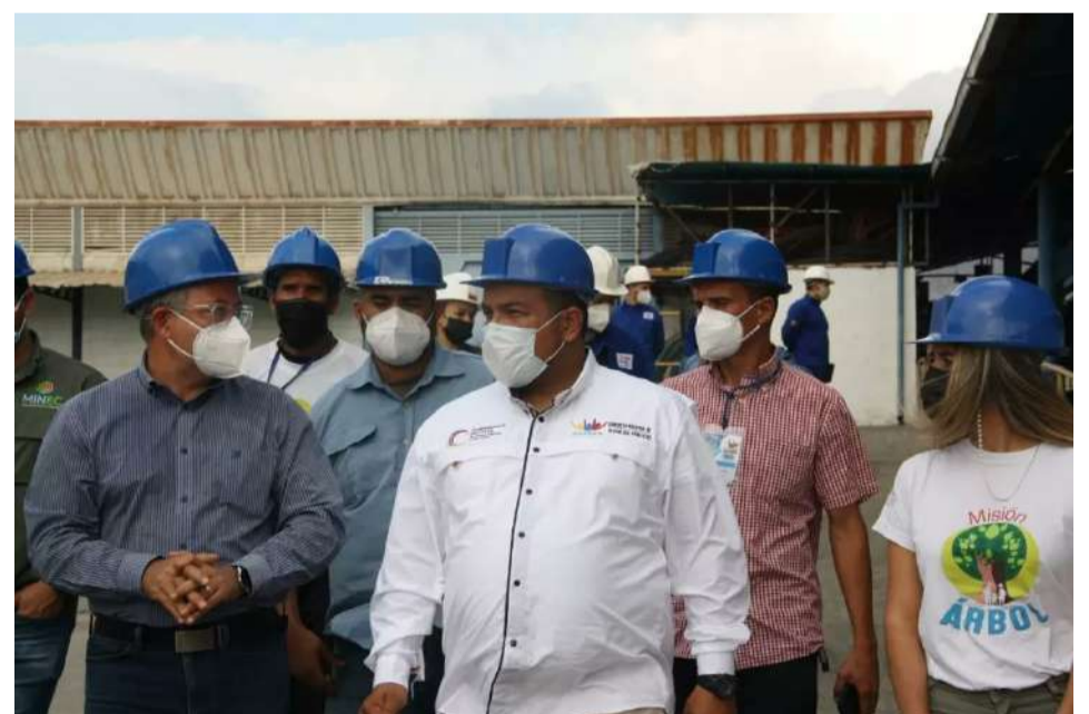
Gobiernos central y regional engranados con el Poder Popular

El ministro se comprometió a comenzar los estudios correspondientes para el saneamiento ambiental del área.