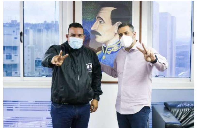
Lorca y Vernaez acordaron avanzar en proyectos ecosocialistas

Añadió que junto con el "Consejo Federal de Gobierno estaremos implementando nuevas formas y métodos, para generar que las políticas públicas en ma-