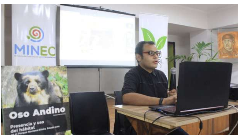
Se contó con ponentes nacionales e internacionales

“Esto es básico para continuar en la educación ambiental de la población venezolana y más allá de nuestras fronteras”, indicó.