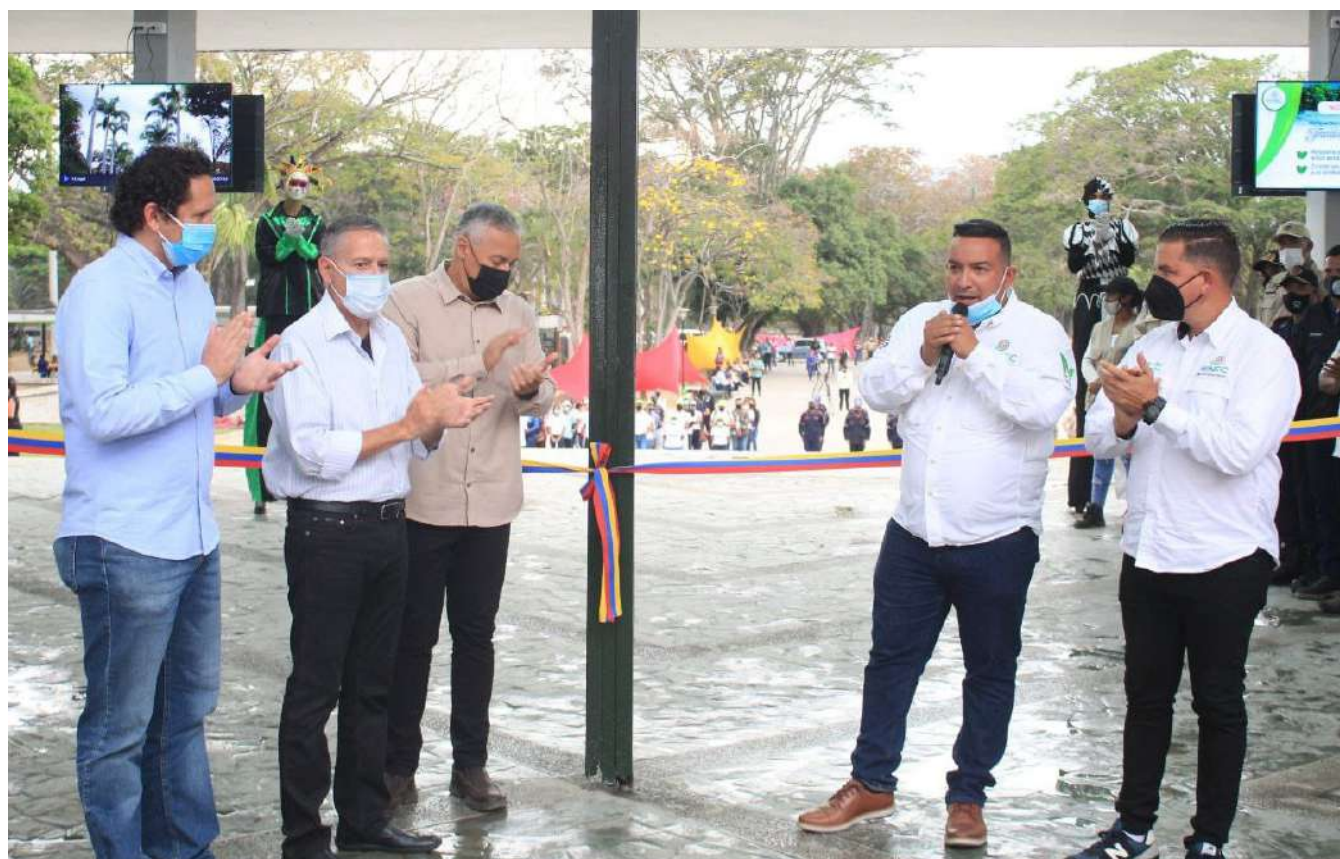
Con esta reinauguración el parque se encuentra 100% operativo en todas sus partes

Este viernes, el ministro del Poder Popular para el Ecosocialismo, Josué Lorca, en compañía de otras autoridades del Ejecutivo, estatales y municipales, participó en el acto de reinauguración de la fachada principal del Parque Recreacional Generalísimo Francisco de Miranda.