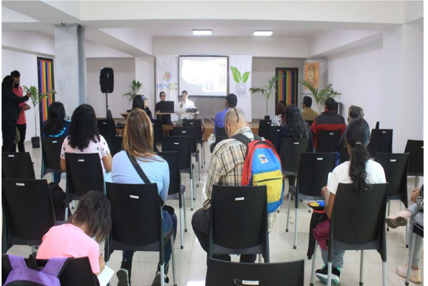
Con estas actividades se pretende masificar las investigaciones en materia ambiental

“Hemos tenido una presentación de altura, con tres ponentes de