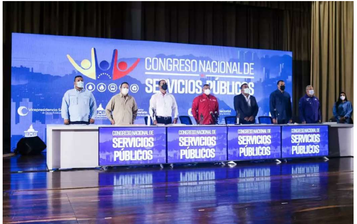
Los Ministerios que integran el sector de servicios públicos atienden a cada entidad