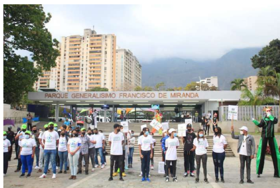
Niñas y niños podrán disfrutar a plenitud del Parque

Entre tanto, la autoridad de Turismo, Alí Padrón, comentó que lo ocurrido es una gran noticia para Caracas y Venezuela “que tengamos a la disposición de visitantes y turistas este hermoso espacio caraqueño, contemplativo para el disfrute y el deporte, para los