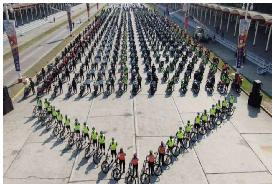
Servidores del MINEC se suman al operativo Carnavales Bioseguros y Felices

Asimismo, durante el asueto de Carnaval se desarrollará la campaña “Dale la cola a la basura”, iniciativa que suma más de 600 personas, entre hombres y mujeres que