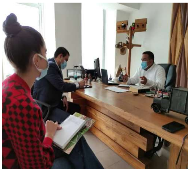
Trabajaron en la ampliación de la oferta de los productos de madera

El Ministerio de Economía, Finanzas y Comercio Exterior conjuntamente con el de Ecosocialismo y la empresa Maderas de Venezuela y Turquía (Mavetur), sostuvieron un encuentro para establecer una hoja de ruta que permita agilizar los trámites con miras a fortalecer las exportaciones del sector forestal en 2022.