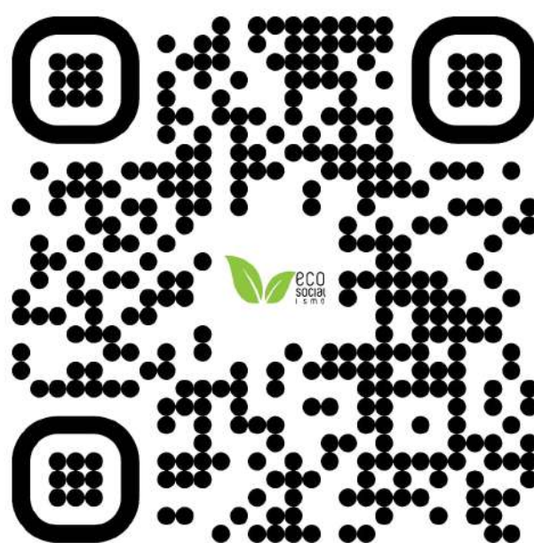
Si deseas descargar el presente artículo a tu dispositivo escanea el código QR

Nuestra nación está pasando por un importante momento de recuperación económica, que seguramente nos llevará en éste año 2022 a retomar los niveles de consumo tradicionales, aprovechemos el impulso para hacerlo inteligentemente, pensando en que el planeta amerita atención. Entonces con el auge emprendedor y la mejoría en el poder adquisitivo, vamos a transformar nuestra economía, sin seguir repitiendo los patrones desarrollistas del capitalismo, pasemos al buen vivir que nos brinda el Ecosocialismo, con conciencia, moderación e innovación.