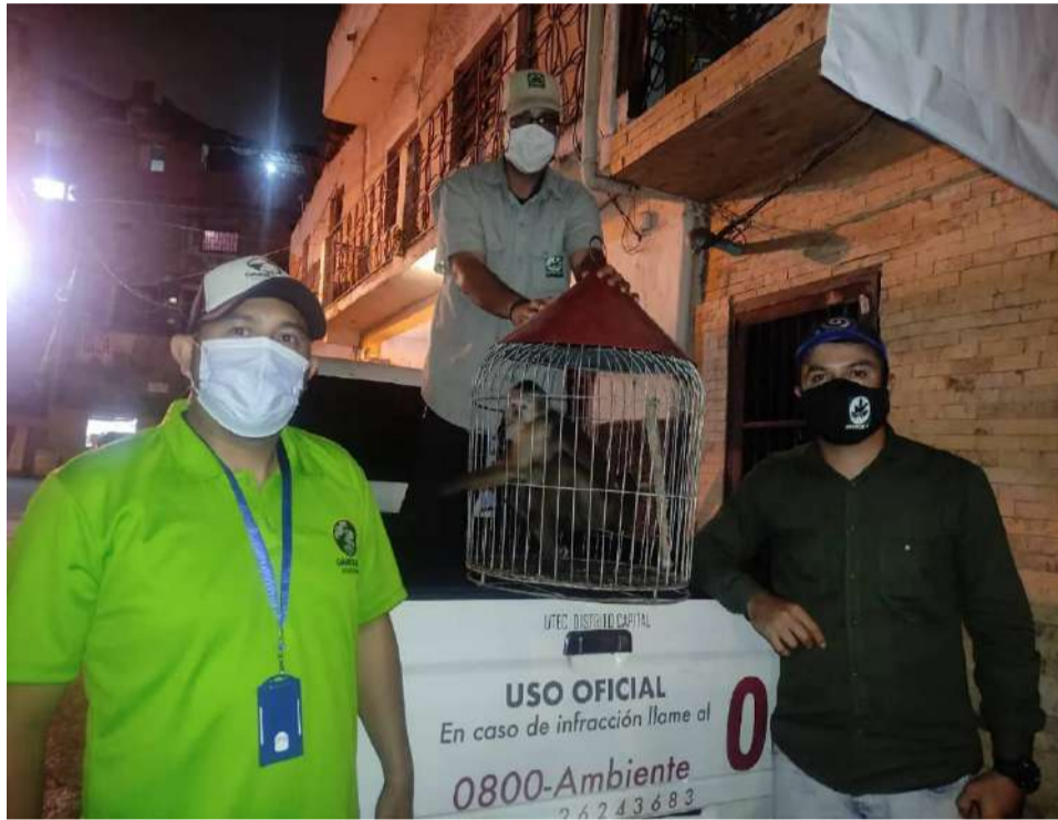
O espécime foi transferido para o Zoológico de Caricuao

Uma comissão formada por funcionários do Instituto de Parques Nacionais (Inparques) e da