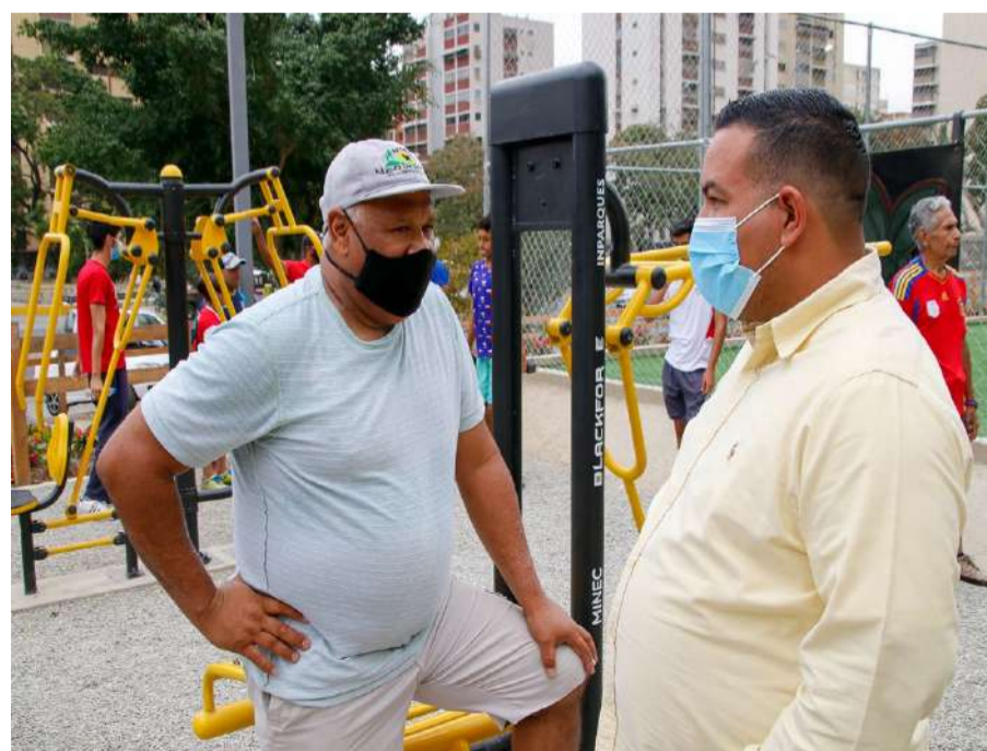
Ministro Lorca supervisionou a atividade

Comentou que desta vez foi para o "Parque Recreativo Ruíz Pineda de Montalbán, recentemente reaberto, com a notícia de ter quadras feitas com material de pneus em fim de vida (NFU), o que as tor-