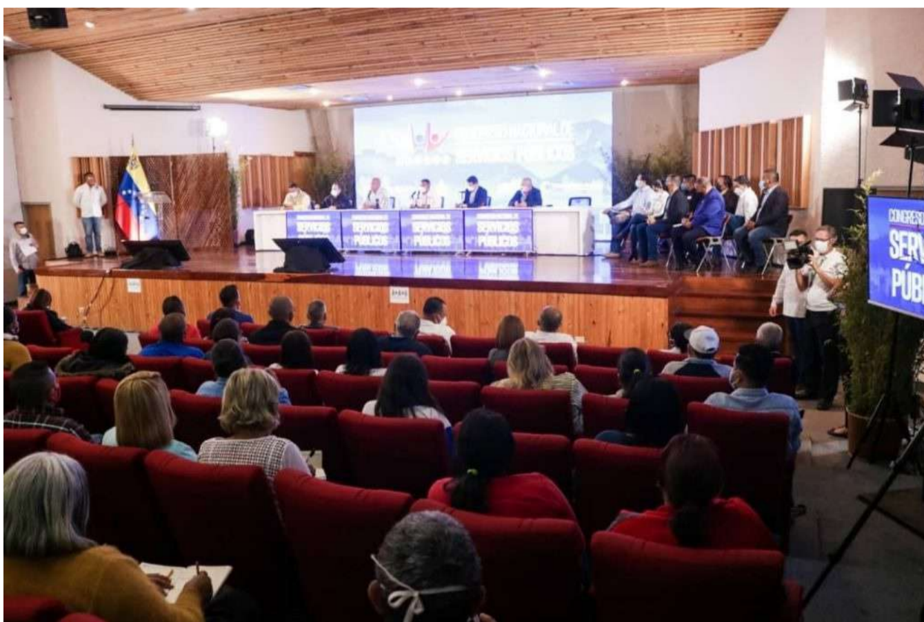
O Congresso será implantado nos 23 estados do país

O Vice-Presidente Setorial indicou que, em primeiro lugar, o objetivo do Congresso é criar um planejamento e estrutura conjunta, com todas as expressões do Poder Popular, em segundo lugar, soma-se o parlamentarismo de rua com os deputados da Assembleia Nacional, com o governo