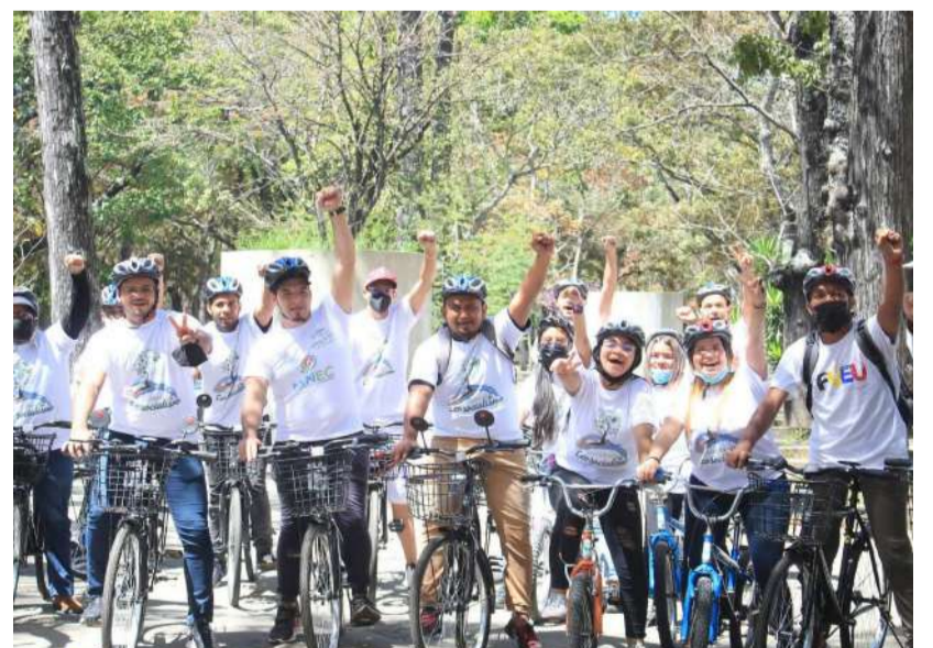
As bicicletas entregues fortalecerão o uso das ciclovias

Da mesma forma, a oferta de bicicletas fortalecerá o uso de ciclovias na capital pelos estudantes universitários. Essas ações buscam fortalecer a educação ambiental de nosso povo e contribuir para a realização do 5º objetivo