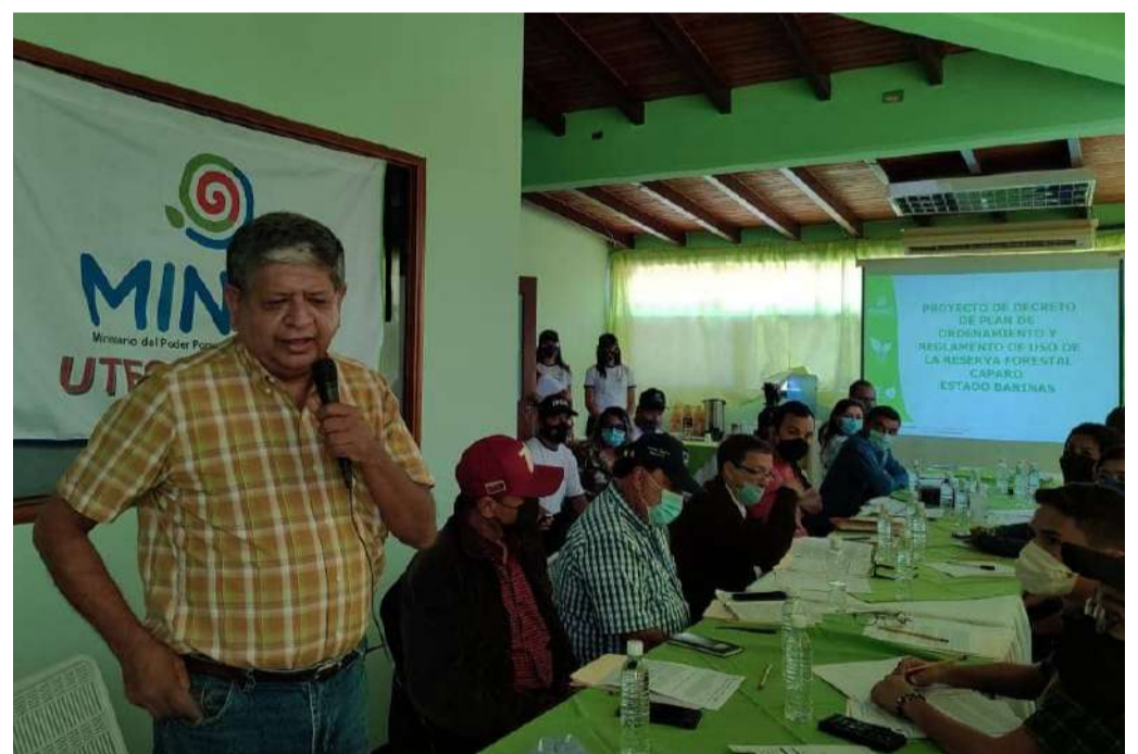
No dia 14 de março, será realizada uma abordagem nas comunidades da Reserva Florestal do Caparo

Os endereços de e-mail para os quais as propostas podem