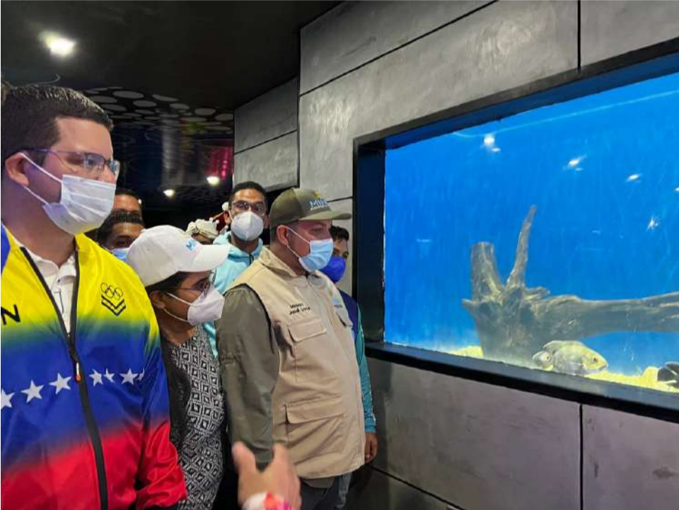
El ZooAquarium fortalecerá todo el sistema nacional de acuarios y de zoológicos del país

Con presencia del ministro del Poder Popular para el Ecosocialismo, Josué Lorca, y el alcalde del municipio Valencia,