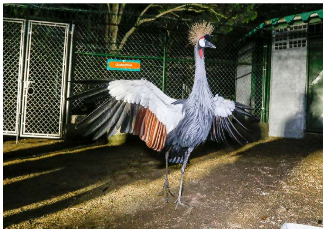
Los ejemplares permanecen en el zoológico de Caricuao en cuarentena mientras se reubican

Lorca indicó que los animales "están entrando en un período de cuarentena, en una zona estéril, en la que recibirán los cuidados del personal para evaluar su adaptación, evolución y posteriormente, de acuerdo con el Plan Nacional de Zoológicos de Venezuela, serán ubicados o dejados aquí (Caricuao), según lo que se decida en el grupo de todos los zoológicos del país".