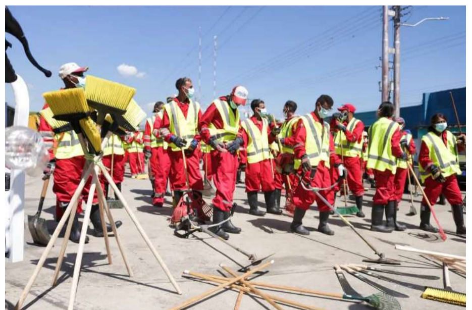
Se entregaron diversos equipos e implementos

Asimismo, manifestó que los equipos son necesarios para fortalecer el despliegue y “ser más eficientes cada día”.