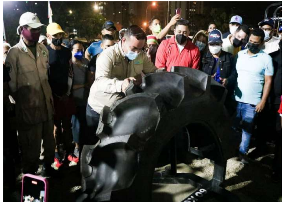
Este es un espacio para la vida y el buen vivir del pueblo

"Este sitio es para la actividad física, el deporte y la recreación de nuestros niños, jóvenes, adultos y adultos mayores, con el compromiso además del cuidado y mantenimiento por parte de la comunidad", sostuvo Maldonado.