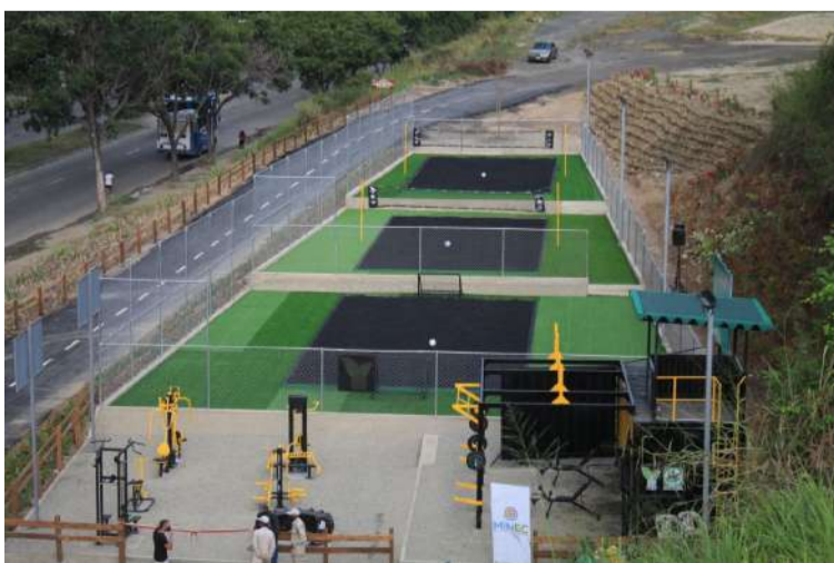
Las instalaciones fueron construidas con material 100% reciclado

Meléndez afirmó que "todos los cauchos que encontremos en Caracas, los vamos a almacenar y construir canchas de estas ecológicas, en todas las parroquias caraqueñas".