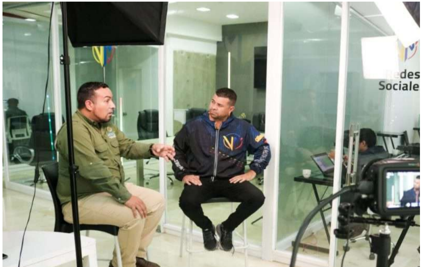
Venezuela trabaja mancomunadamente por el desarrollo económico y cuidado del ambiente

El ministro destacó que Venezuela no sostiene una política en la que se sacrifican los ecosistemas para salvar a la economía, por el contrario se trabaja