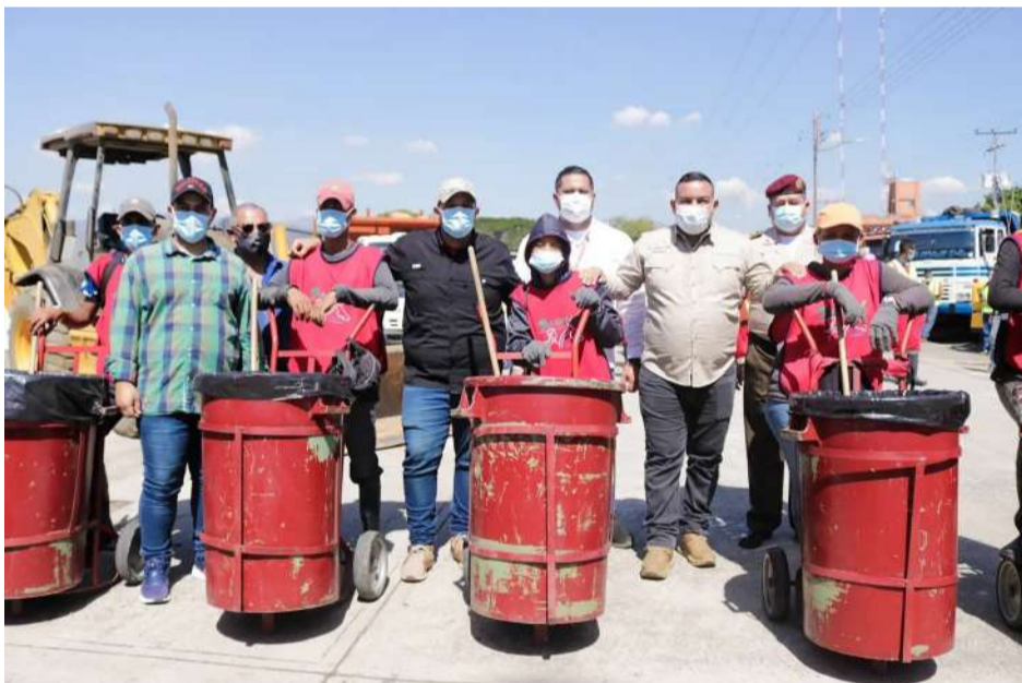
La entrega forma parte del plan de optimización de los servicios públicos

E l ministro del Poder Popular para el Ecosocialismo, Josué Lorca, participó en el acto de entrega de equipos y herramientas para el aseo, a cuadrillas de limpieza del municipio Libertador del estado Carabobo.