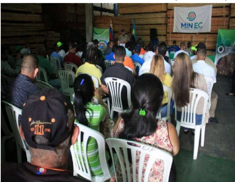
A atividade foi desenvolvida na empresa Maderas Orientales