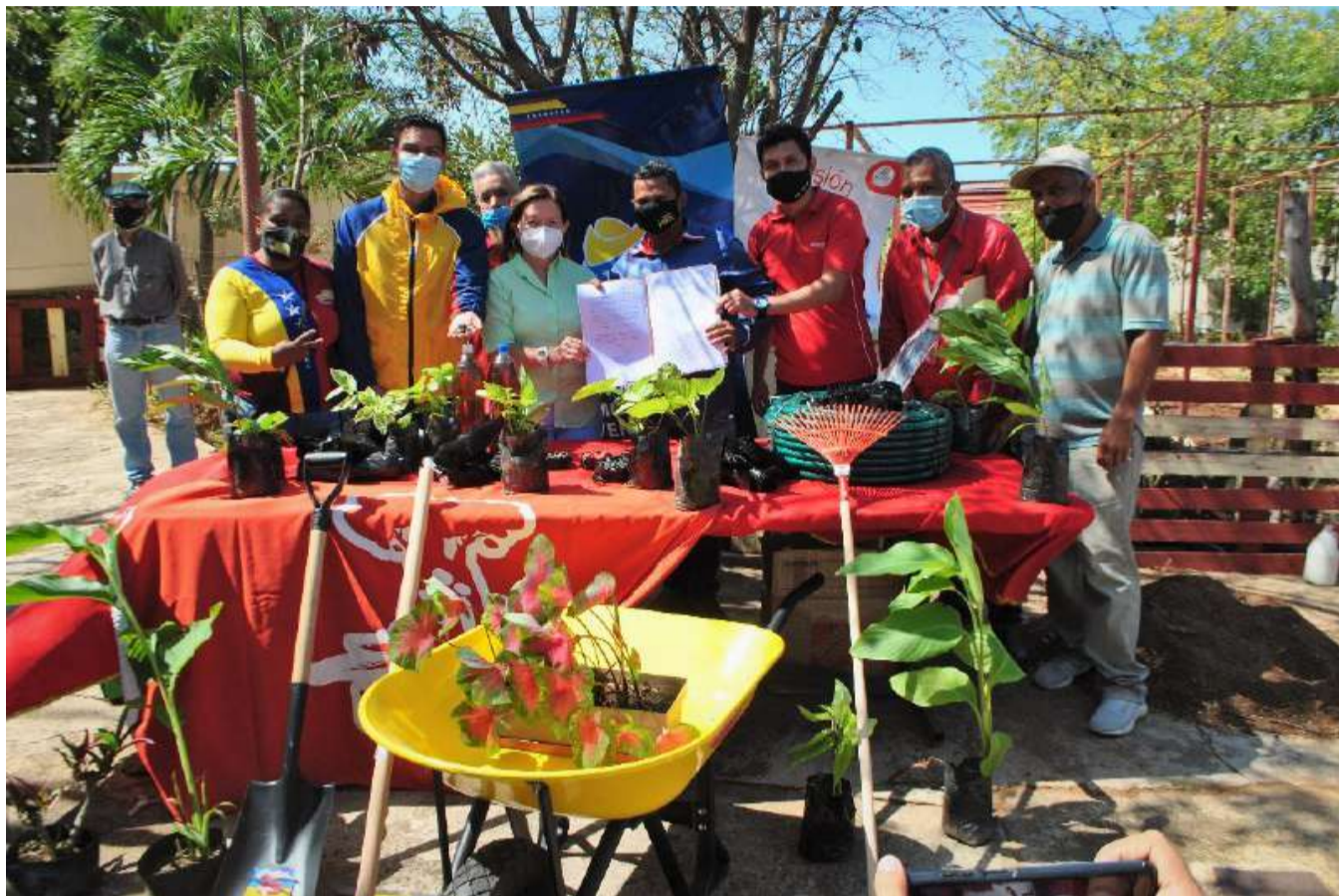
Árvores frutíferas e medicinais serão plantadas no centro de produção

O Ministério do Poder Popular para o Ecosocialismo por meio da Missão Árvore, entregou um Viveiro Comunitário para idosos residentes no Instituto Nacional de Assistência Social (Inass), no município de Catia La Mar, estado de La Guaira.