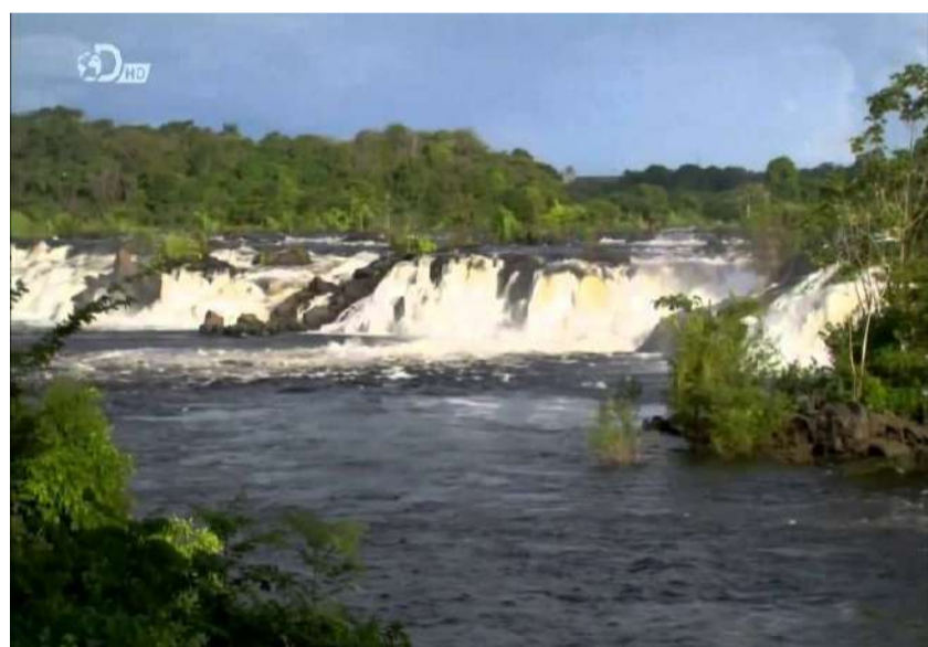
Venezuela indomável e selvagem mostra a imensidão da paisagem nacional

Na continuação do ciclo de fóruns cinematográficos denominados "Mudanças Climáticas: Pessoas, Planeta e Vida, a Direção Geral de Capacitação do Ministério