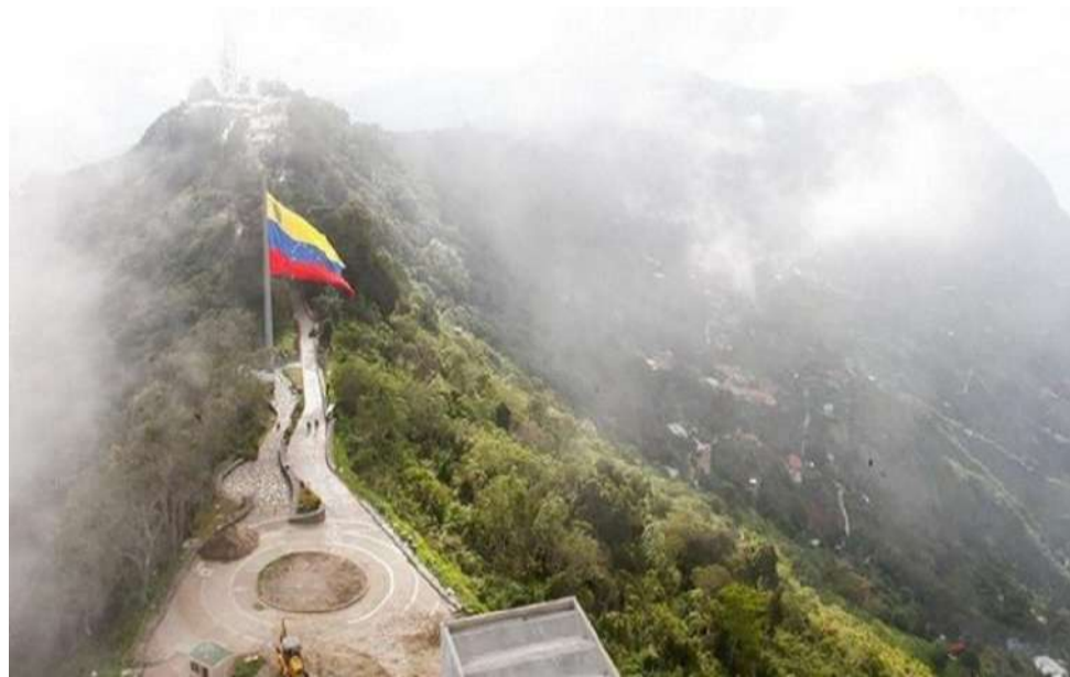
Mais de 85.192 hectares compõem o Parque Nacional Waraira Repano

No dia 12 de dezembro, o Parque Nacional Waraira Repano comemora 63 anos de ter sido declarado o pulmão vegetal de Caracas. A montanha dá identidade à capital, além de ser um espaço extraordinário que por mais de um século foi ícone e motivo de representação para os venezuelanos.