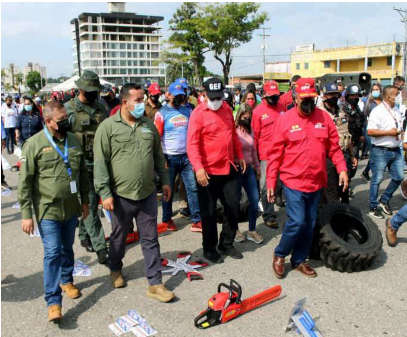
Os veículos pesados foram equipados com pneus, baterias e óleos

O ministro Paredes frisou que entre várias instituições do governo nacional e regional, serão melhoradas as instalações dos parques: La Federación, La Carolina e Los Mangos, além disso, serão intervencionados mais de 28 quilômetros de vias internas, entre avenidas e ruas. "O objetivo é atender aos serviços públicos e melhorar a infraestrutura. Melhorar o estado de bem-estar com o embelezamento de espaços religiosos, recreativos e esportivos, museus, entre outros