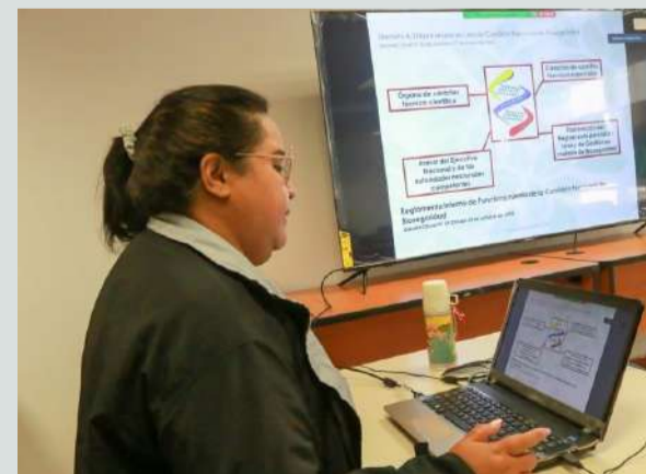
Entre 6 e 10 de dezembro foi realizado o Congresso Internacional