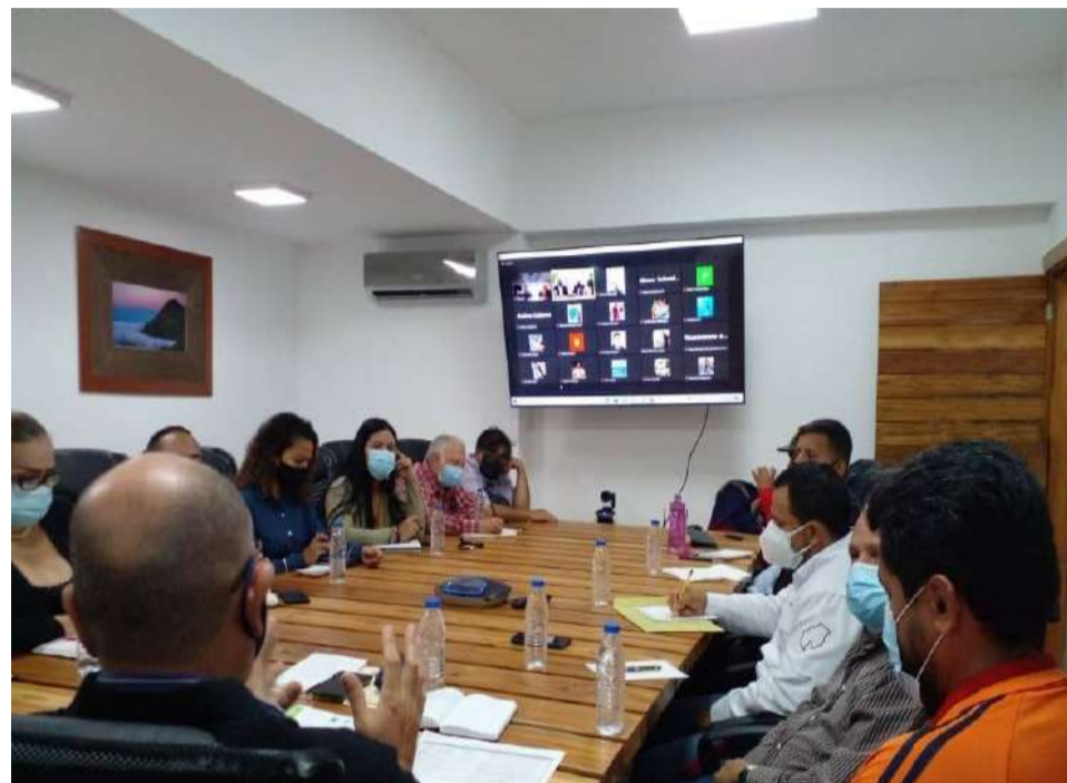
Representantes de diversos ministérios participaram da atividade

"Sobre o assunto existem várias Acrescentou que se avança com