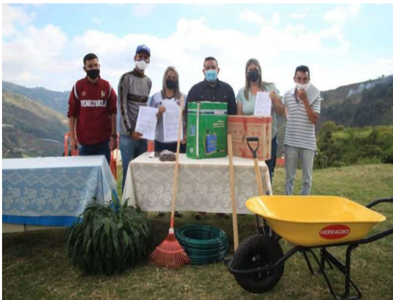
A comunidade de El Jarillo agradeceu ao MINEC pela sessão de atendimento integral

O Ministro do Poder Popular para o Ecosocialismo, Josué Lorca, no âmbito da comemoração do Dia Internacional da Montanha, conduziu uma série de atividades na comunidade de El Jarillo, no município de Guaicaipuro, no estado de Miranda.