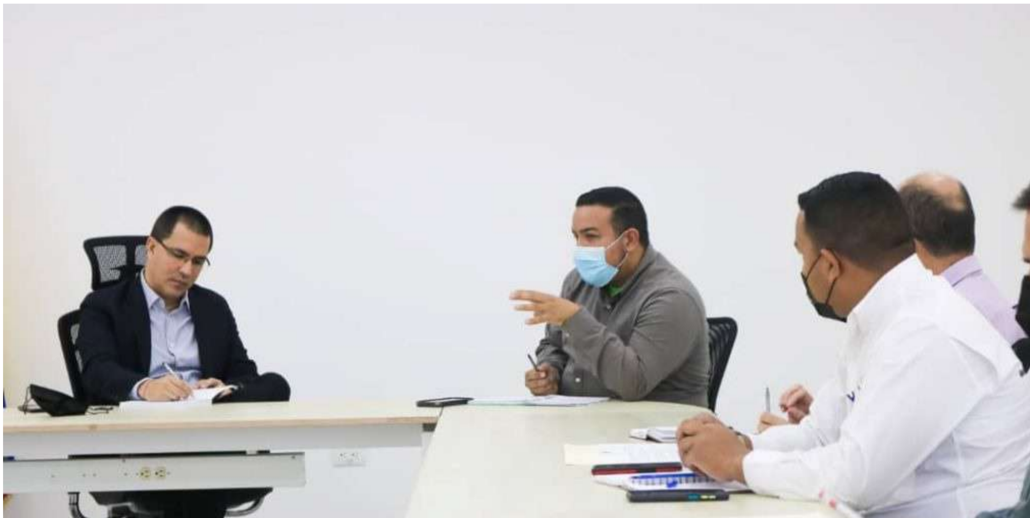
Eles avaliam a criação de centros de coleta de Resíduos de Equipamentos Elétricos e Eletrônicos

Para tratar de temas como reciclagem e gestão adequada dos resíduos sólidos, o ministro do Poder Popular para o Ecosocialismo, Josué Lorca, teve encontro com o responsável da Indústria e Produção Nacional, Jorge Arreaza.