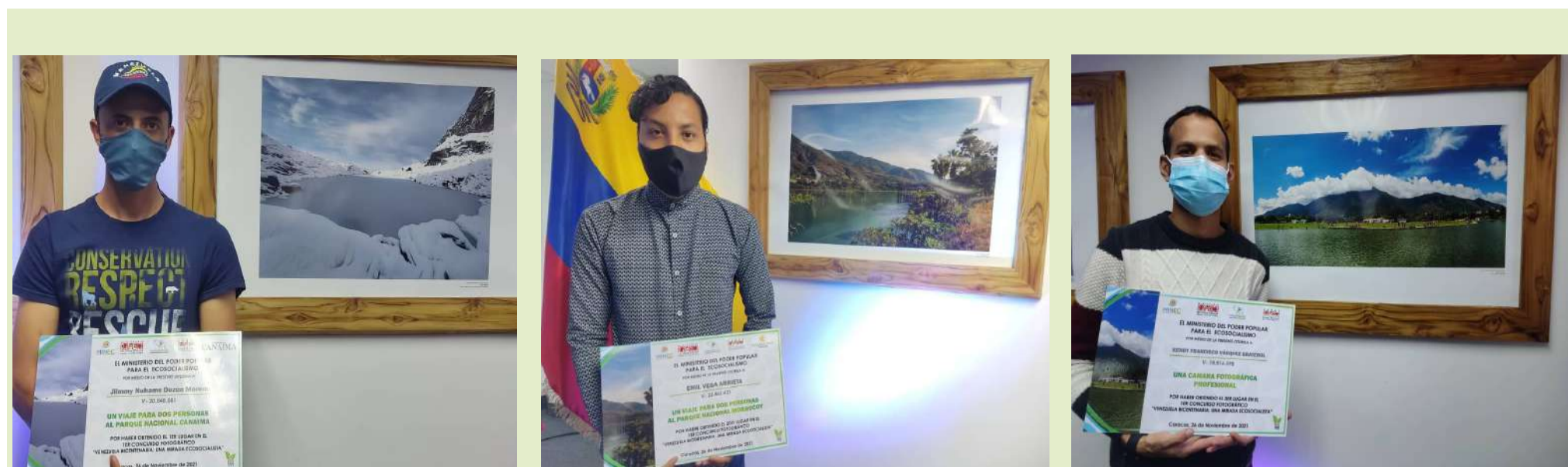
(Da esquerda para a direita) Vencedores do primeiro ao terceiro lugar exibem seus trabalhos

“Para mim é uma honra exaltar a beleza de Caracas e nada melhor do que fazê-lo com o que dá o norte a cada um de Caracas: Ávila, fonte de inspiração para muitos e para fotografar”, disse.