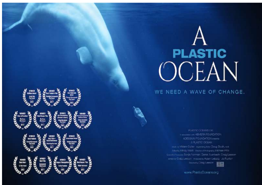
A obra audiovisual foi produzida pelo cineasta, jornalista e amante da natureza Craig Leeson

Essas partículas são inevitavelmente ingeridas pela fauna marinha, por isso as toxinas afetam a cadeia alimentar. No audiovisual, o efeito em aves migratórias e em algumas áreas habitadas por humanos também é mostrado.