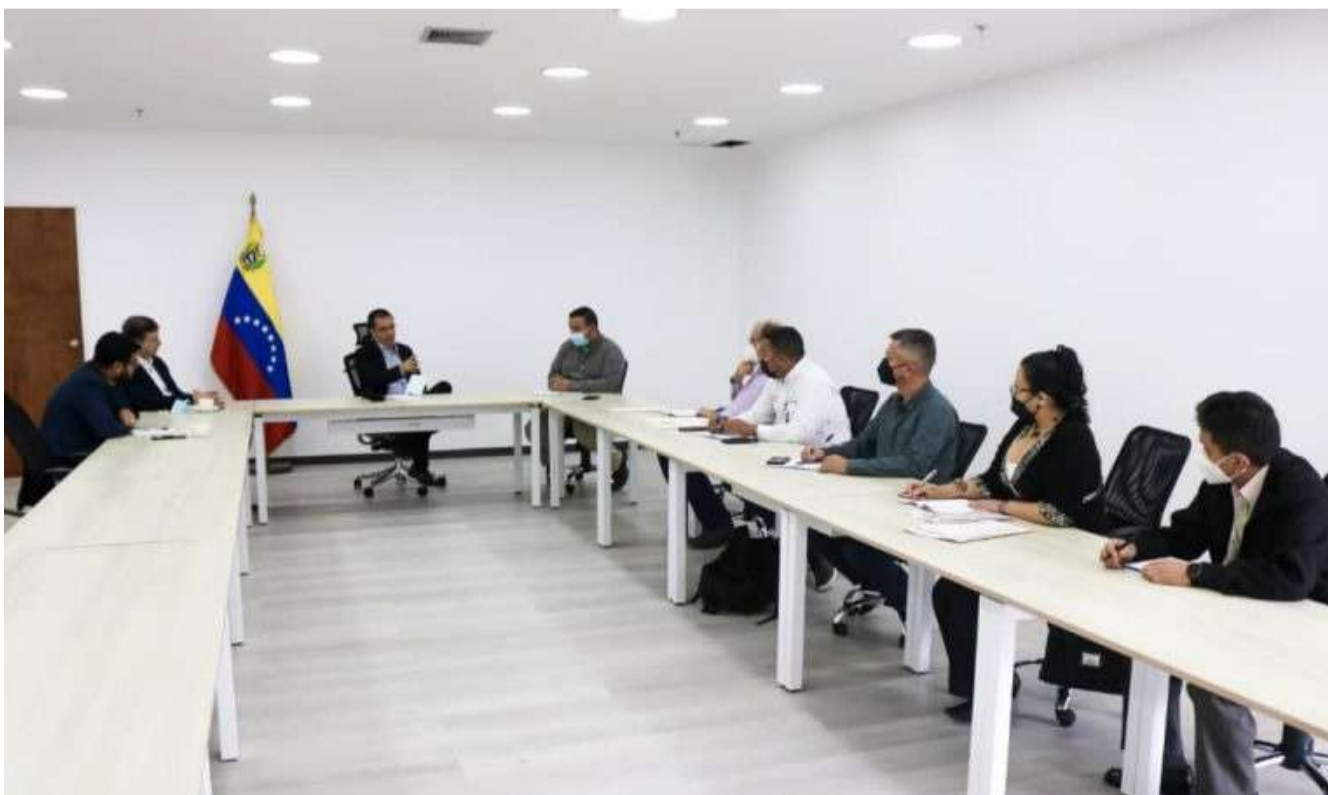
No encontro, foram discutidas formas de aproveitamento dos resíduos sólidos

Da mesma forma, foi feita uma revisão e balanço de tudo o que tem constituído os desdobramentos das Jornadas Nacionais de Adaptação das Indústrias Florestais.