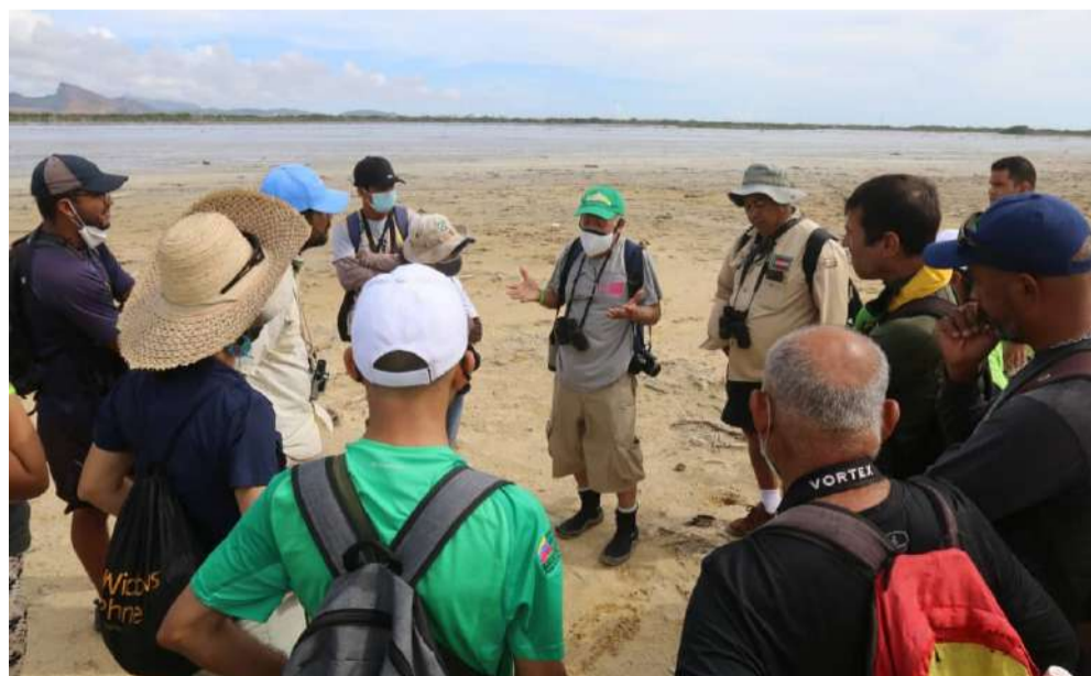
Trabalhadores do Minec e membros de movimentos ambientalistas participaram da atividade

Além disso, com as informações fornecidas pelo monitoramento, é possível determinar o tamanho das populações, o sexo, a longevidade e as tendências dos grupos.