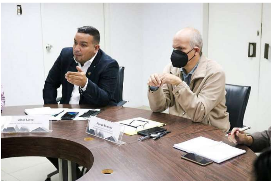
A atividade foi chefiada pela Vice-Presidência de Planejamento e Ministério do Poder Popular para o Ecossocialismo

Esta Comissão Presidencial será composta também por servidores dos Ministérios do Poder Popular para as Relações Exteriores; Economia, Finanças e Comércio Exterior; Indústrias e Produção Nacional; Povos Indígenas; Habitat e Habitação; e Serviço de Água.