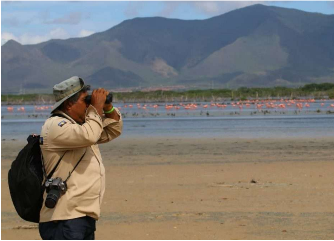
Los monitoreos podrán determinar los tamaños de las poblaciones, sexo, longevidad y tendencias de las agrupaciones

Con la finalidad de hacer un seguimiento y control efectivo de las aves silvestres en la región insular, realizaron durante cinco días un Taller de Anillado y Monitoreo de los pájaros playeros residentes y migratorios en el estado Nueva Esparta, en el que se pudieron observar más de mil 300 flamencos en el Monumento Natural Laguna de Marites.