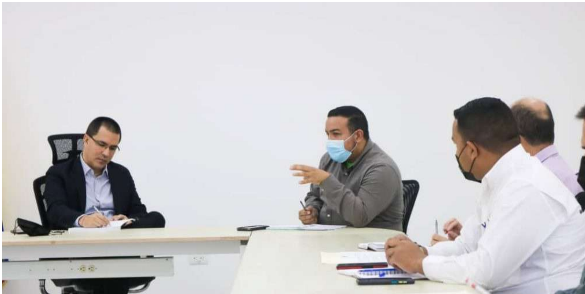
Evalúan la creación centros de acopio para Residuos de Aparatos Eléctricos y Electrónicos