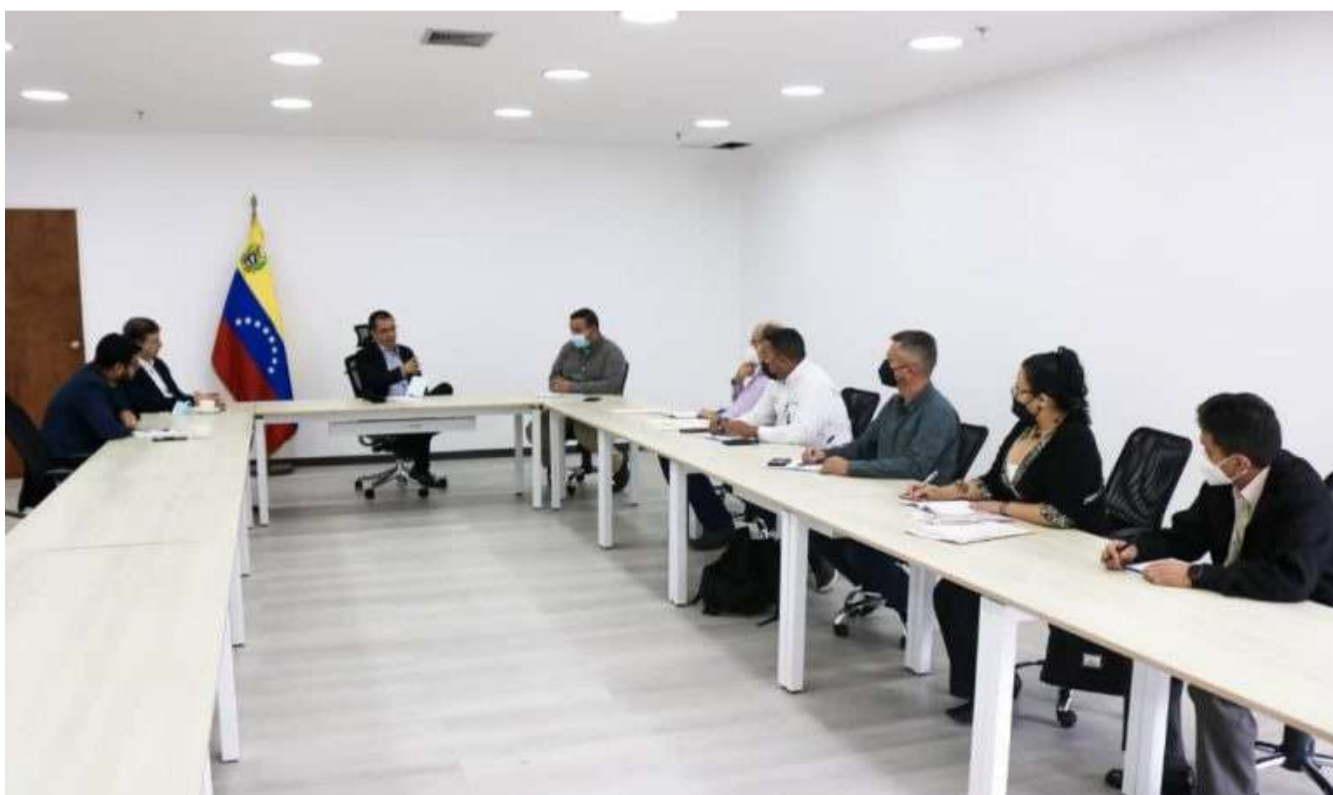
En el encuentro se trataron formas de aprovechamiento de los desechos sólidos

Asimismo, se hizo un repaso y balance de todo lo que ha constituido los despliegues para las Jornadas Nacionales de Adecuaciones de Industrias Forestales.