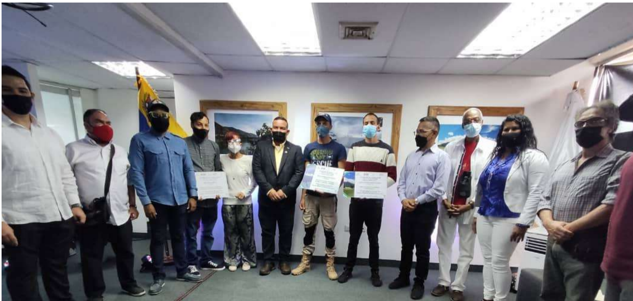
Los ministros Lorca y Villegas hicieron entrega de los premios y reconocimientos

E l ministro del Poder Popular para Ecosocialismo, Josué Lorca, entregó junto al ministro del Poder Popular para Cultura, Ernesto Villegas, los premios del 1er. Concurso “Venezuela Bicentenario: Una mirada ecosocialista”.