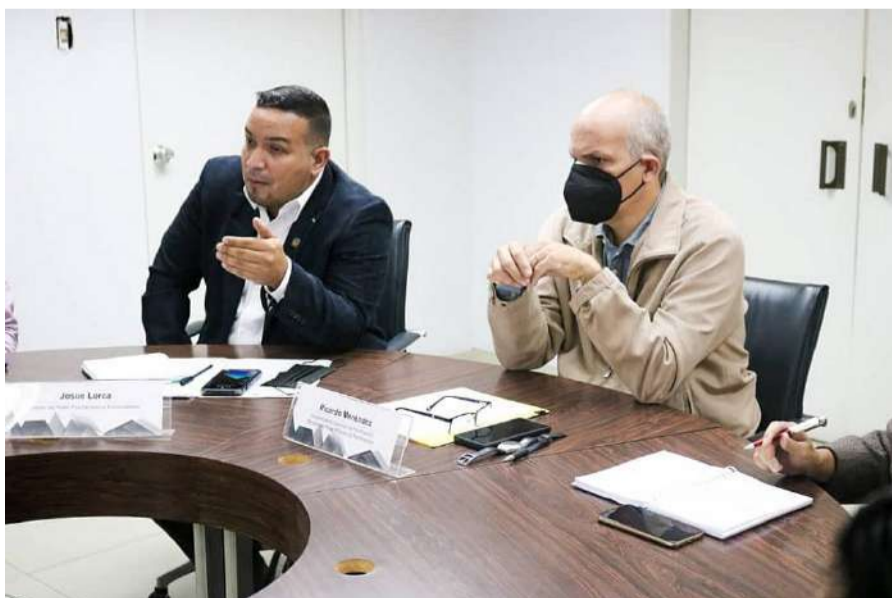
La actividad fue encabezada por la Vicepresidencia de Planificación y el Ministerio del Poder Popular para el Ecosocialismo

Esta Comisión presidencial estará también integrada por servidoras y servidores de los Ministerios del Poder Popular para Relaciones Exteriores; Economía, Finanzas y Comercio Exterior; Industrias y Producción Nacional; Pueblos Indígenas; Hábitat y Vivienda; y de Atención de Aguas.