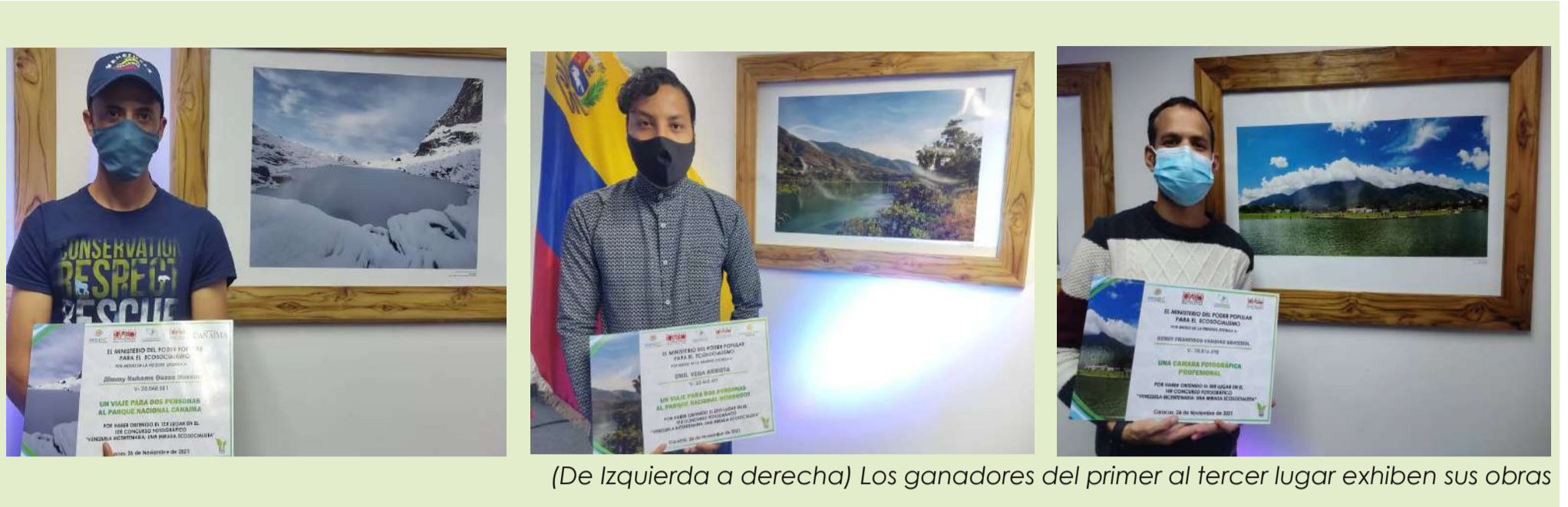
(De izquierda a derecha) Los ganadores del primer al tercer lugar exhiben sus obras