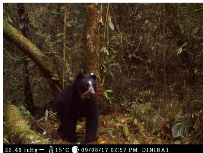
22.49 inHg — 15°C 09/08/17 02:57 PM DINIRA1 O urso frontin em seu habitat natural