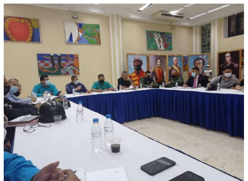
Em perfeito andamento, instituições do Governo Bolivariano atendem ao problema da poda

Da mesma forma, o Minec chamou a atenção para as