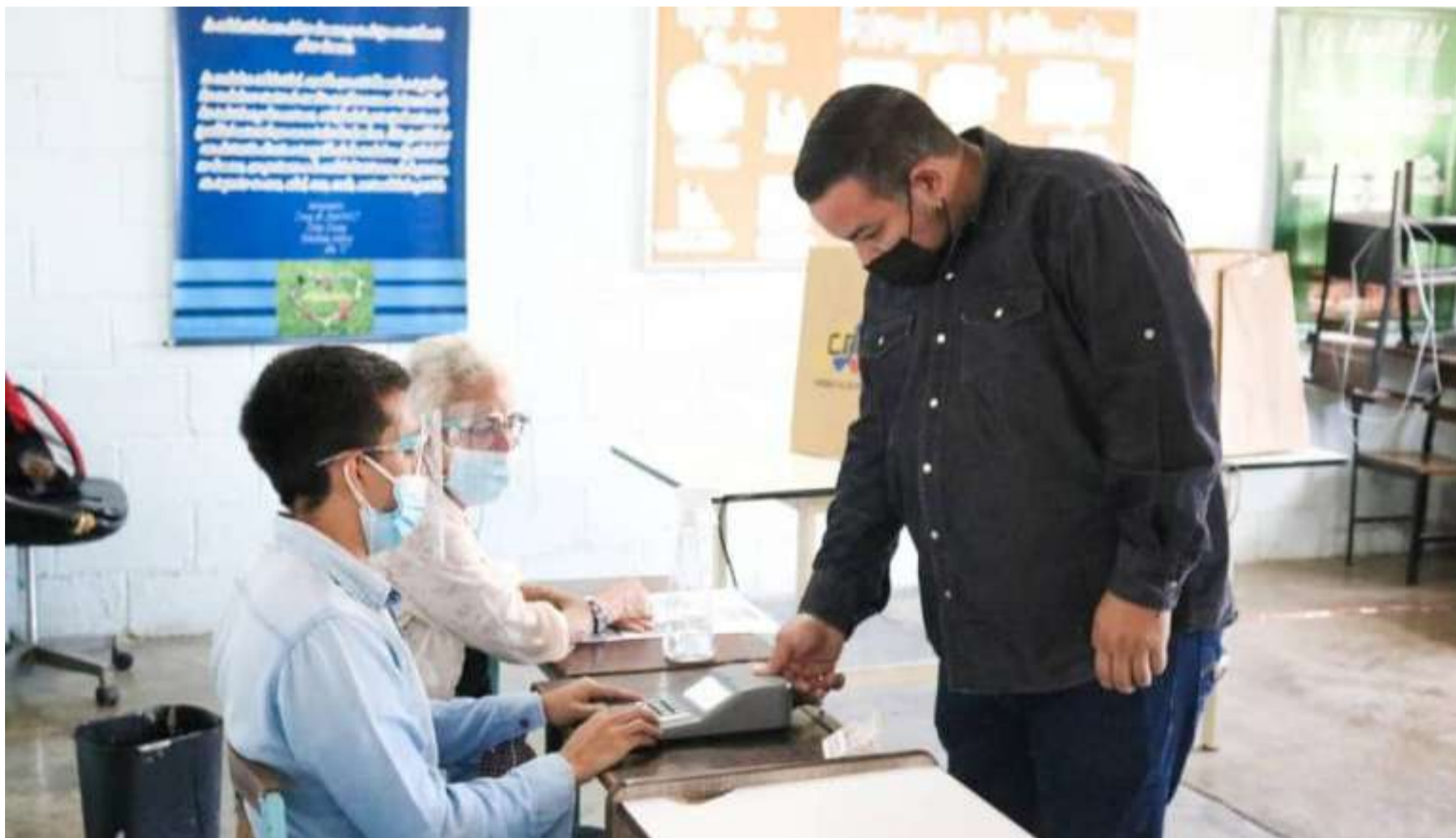
Lorca exerceu seu direito de voto no estado de Miranda

O ministro do Poder Popular para o Ecosocialismo, Josué Lorca, dirigiu-se ao centro de votação instalado na Unidade Educativa Nacional Bolivariana Vicente Salías na madrugada deste domingo para exercer o seu direito de voto.