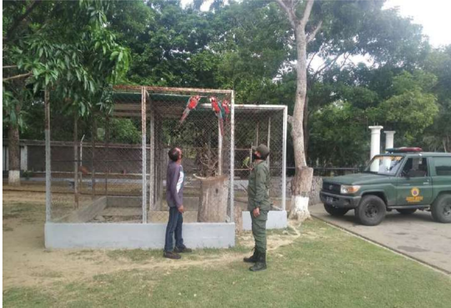
Os espécimes estão sob custódia do Minec

O Ministério do Poder Popular para o Ecosocialismo (Minec), por meio da Unidade Territorial Ecosocialista (UTEC) Miranda, na companhia de integrantes