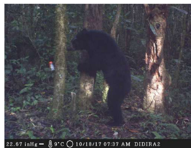
22.67 inHg — 9°C 10/18/17 07:37 AM DIDIRA2 O urso frontin em seu habitat natural

Acrescentou que “queremos dizer ao país que estes livros fazem parte das políticas de lançamento de todo o processo de formação, investigação, publicação e divulgação levado a cabo pelo Minec”.