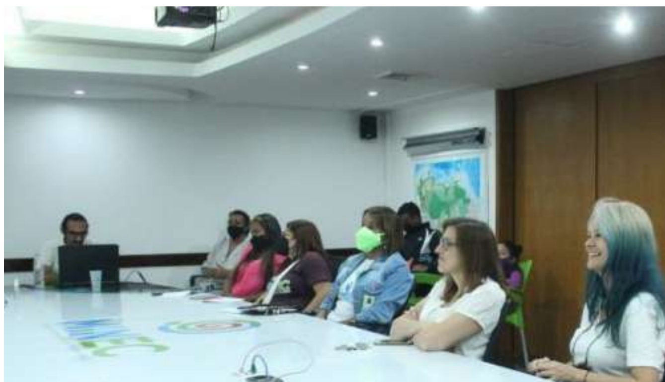
A reunião mostrou o andamento de várias investigações

Slibe destacou que o Ministro Lorca teve uma intervenção que qualificou de “extraordinária na COP26”, com a qual a Venezuela se destaca com o Quinto Objetivo Histórico do Plan de la Patria 2019-2025.