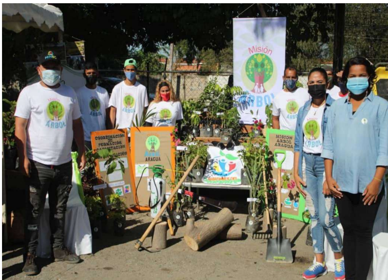
Com esta certificação, produtores vão gerar espaços de trabalho em suas comunidades

Em continuidade às Jornadas de Adequação das Indústrias Florestais, o Ministério do Poder Popular para o Ecosocialismo (Minec), entregou 32 certificados de instalação e operação, a pessoas ligadas ao setor madeireiro do estado de Aragua, com os quais são 592 autorizações em o país.