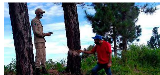
Foi declarado Parque Nacional pelo Decreto nº 2.347 em 5 de junho de 1992

para as aldeias do Rechazo, Platanal, Bucaritas, Miracuy, Fila Rica e Nuezalito de Guache no estado de Lara.