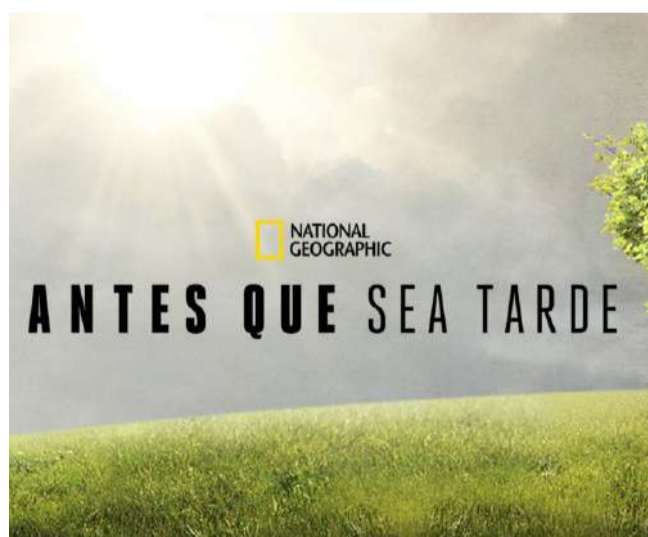
Leonardo DiCaprio se reúne com especialistas, cientistas e líderes mundiais para discutir as mudanças climáticas e suas consequências

A obra audiovisual produzida pelo National Geographic Channel, apresenta como moderador o ator e ativista ambiental, designado em 2016 o mensageiro da Organização das Nações Unidas (ONU) contra as mudanças climáticas, Leonardo DiCaprio, que percorre diversos países e entrevista diferentes personalidades do meio científico e político mundo, a fim de saber a gravidade do problema que o Planeta Terra está passando.