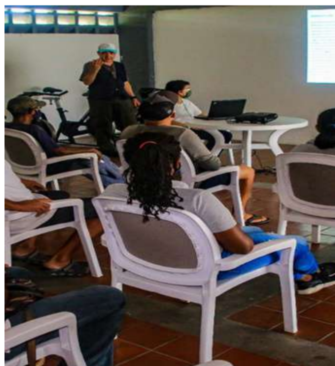
Um total de 15 pessoas participaram do taller

No âmbito dos compromissos do Ministério do Poder Popular para o Ecosocialismo (MINEC), com os clubes da população de Carenero, no estado de Miranda, foi realizada uma palestra que se chamou "Convivência entre gentes e crocodilos", aliás do avistamento de crocodilos do litoral nas marinas da região.