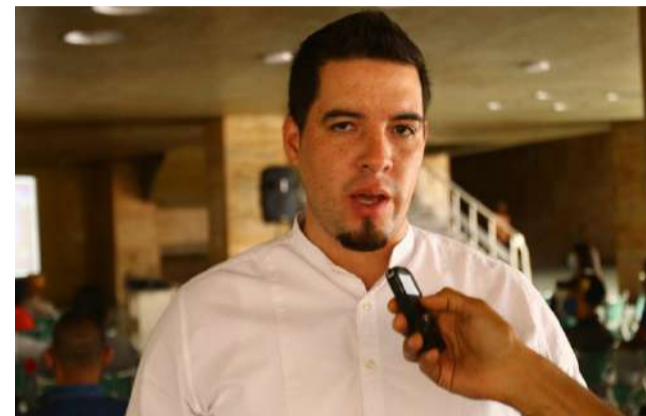
Jesús Méndez: Continuamos em constante processo de capacitação e conscientização de nossos colaboradores

Durante o filme, o ator e ativista ambiental Leonardo DiCaprio se reúne com especialistas,