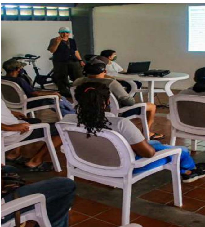
Un total de 15 personas participaron en el taller

Como parte de los compromisos del Ministerio del Poder Popular para el Ecosocialismo (Minec), con los clubes de la población de Carenero, en el estado Miranda, se desarrolló una charla que fue denominada "Convivencia entre la gente y los cocodrilos", a propósito del avistamiento de caimanes de la costa en las marinas de la región.