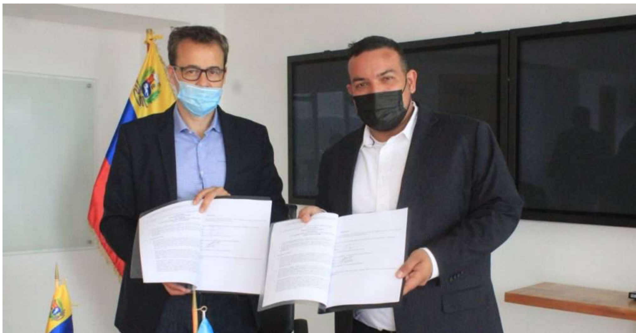
Venezuela recibirá servicio y apoyo técnico de la FAO

E l Ministerio del Poder Popular para el Ecosocialismo (MINEC), a través de la Compañía Nacional de Reforestación (Conare) y el Instituto Nacional de Parques (Inparques), firmó un acuerdo de servicio y apoyo técnico con la Organización de las Naciones Unidas para la Alimentación y la Agricultura (FAO) como parte del proyecto de Ordenación Forestal Sustentable y Conservación de Bosques en la perspectiva Ecosocial.