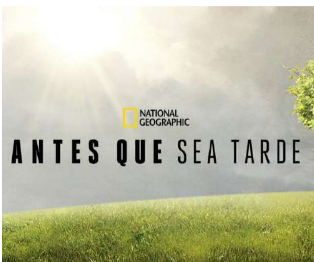
Leonardo DiCaprio se reúne con expertos, científicos y líderes mundiales para discutir los cambios y las consecuencias del clima

La pieza audiovisual producida por National Geographic Channel, presenta como moderador al actor y activista ambiental, designado en el 2016 mensajero de la Organización de las Naciones Unidas (ONU) contra el cambio climático, Leonardo DiCaprio, quien recorre varios países y entrevista a distintas personalidades del mundo científico y político, con la finalidad de conocer la gravedad del problema por la que atraviesa el Planeta Tierra.