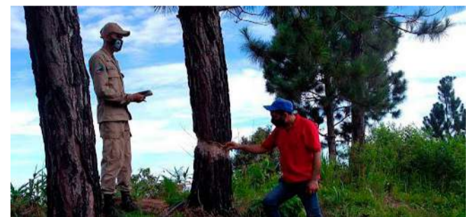
Fue declarado Parque Nacional bajo el Decreto N°2.347

estas vías cruzan el Parque hasta los caseríos El Rechazo, Platanal, Bucaritas, Miracuy, Fila Rica y Nuezalito de Guache en el estado Lara.