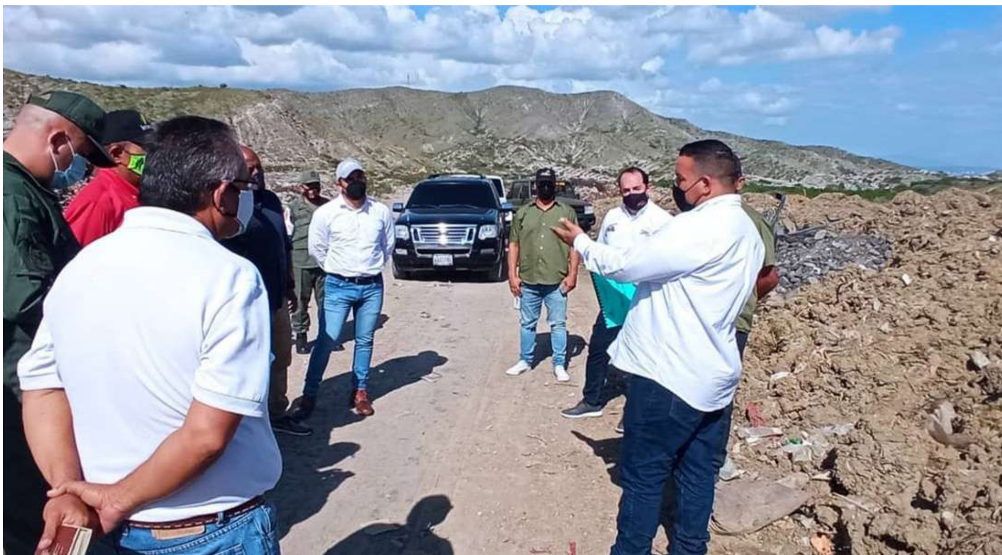
Despliegue nacional de la Vicepresidencia Sectorial busca ofrecer servicios de calidad

Además, se acordó la incorporación de cuatro nuevos pozos de agua profunda al sistema hídrico larense, en función de garantizar el suministro de agua potable en la entidad.